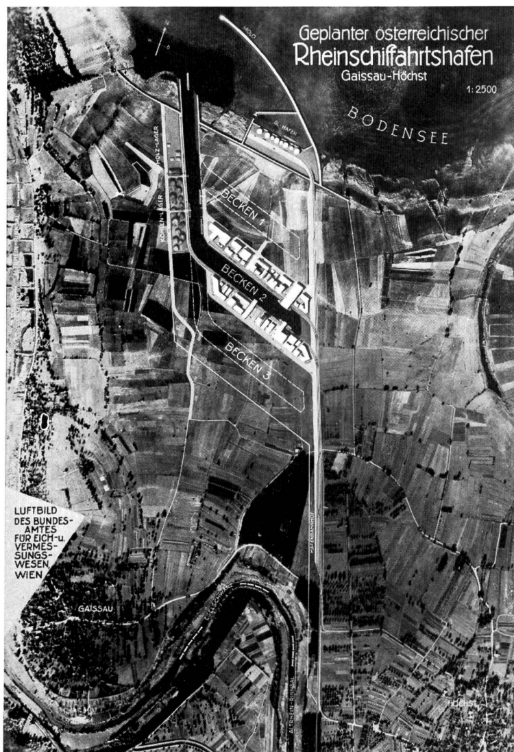
Bild 1 Geplanter österreichischer Hafen am Bodensee zwischen dem Alten Rhein und dem Fussacher Durchstich

Die derzeitige Verschmutzung des Bodensees rührt ausschliesslich daher, dass die Abwässer aus der Industrie und den Haushaltungen seit Jahrzehnten grossteils ungereinigt in den Bodensee geleitet wurden. Eine Sanierung des Sees ist einzig und allein durch den Bau von Kläranlagen, nicht aber durch eine Verhinderung der Hochrheinschiffahrt oder durch sonstige Verbotsmassnahmen möglich. Diese Massnahmen wird man völlig