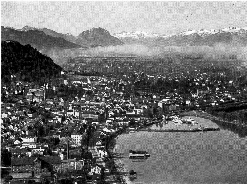
Bild 2 Bregenz, Hauptstadt des österreichischen Landes Vorarlberg, in der östlichen Bodenseebucht. Blick nach Süden, Richtung Rheintal