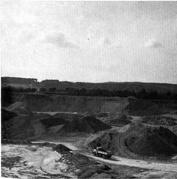
Die grosse Kiesgrube Weiach, einer der für einen zürcherischen Hafen in Betracht gezogenen Standorte.

Vortrag war die Gelegenheit geboten, das vorgesehene Hafengelände in näheren Augenschein zu nehmen.