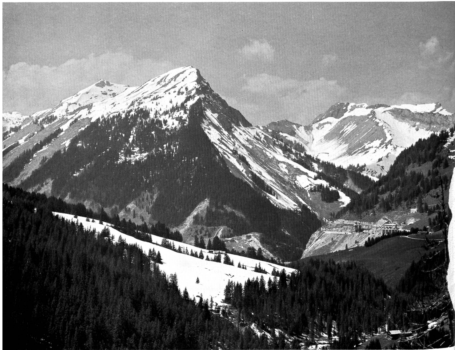
Vue générale du Tabouset; à droite au fond les installations pour les barrages de l'Hongrin