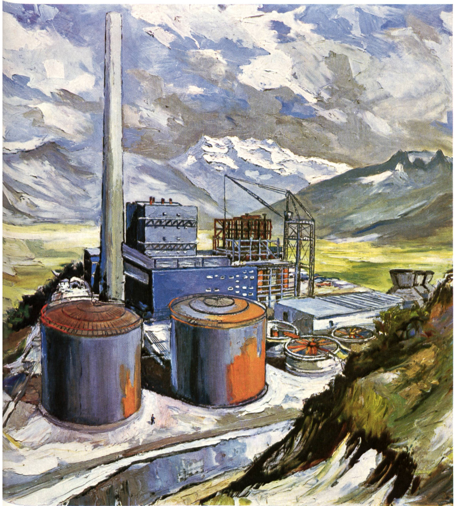
Das Dampfkraftwerk Vouvry auf Alp Chavalon (Wallis) nach einem Gemälde von V. Mulders La centrale thermique de Vouvry sur l'Alpe de Chavalon (Valais) d'après une peinture de V. Mulders