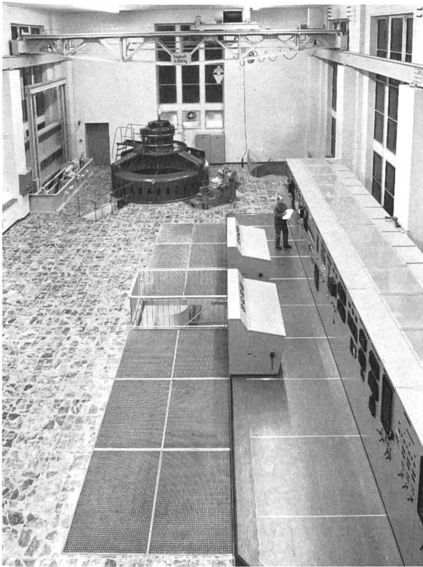
Bild 7 Maschinsaal im umgebauten Kraftwerk Aue. Im Vordergrund die Gitterroste und Montagegedeckel über den beiden neuen Rohrturbinen, im Hintergrund der Generator der revidierten Konus-Francis-turbine.

Um den möglichst raschen Umbau der Wehröffnungen einschliesslich Montage der neuen Schützen gewährleisten zu können, musste auf die Errichtung eines sperrigen Lehrgerüsts für die Betonierung der Wehrbrücke verzichtet werden. Die sechs vorgespannten Hohlkastenträger zur Ueberbrückung der drei Wehröffnungen wurden deshalb seitlich vorfabriziert und mit zwei Bockkranen über eine Dienstbrücke eingefahren. Die je 35 t schweren Elemente wurden, entsprechend ihrem späteren Einsatz als Abwasserkanäle, innen mit einem Anstrich von glasfaserverstärktem Polyesterharz abgedichtet.