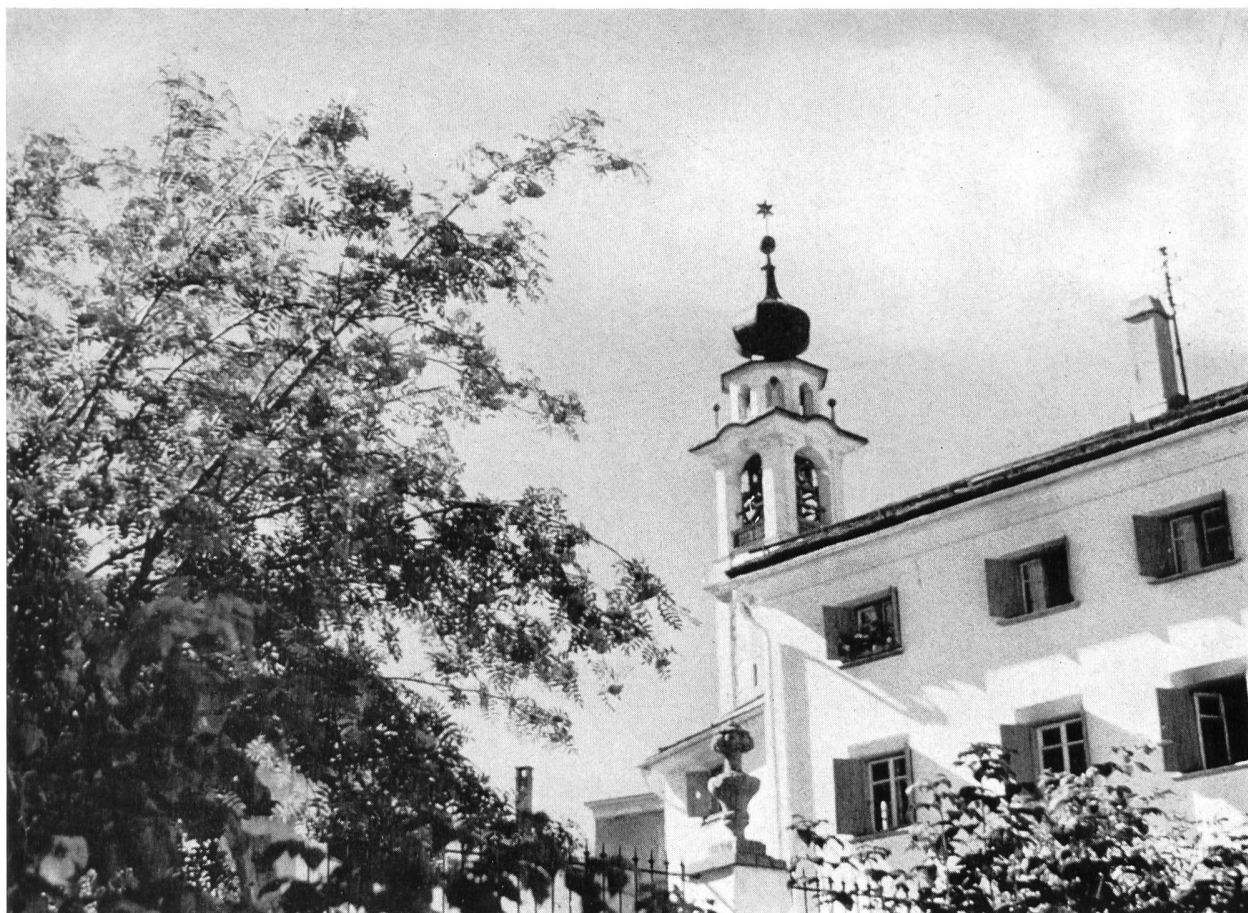
Bild 2 Gemeindehaus — ehemaliges Plantahaus — und barocker Kirchturm von Samedan.