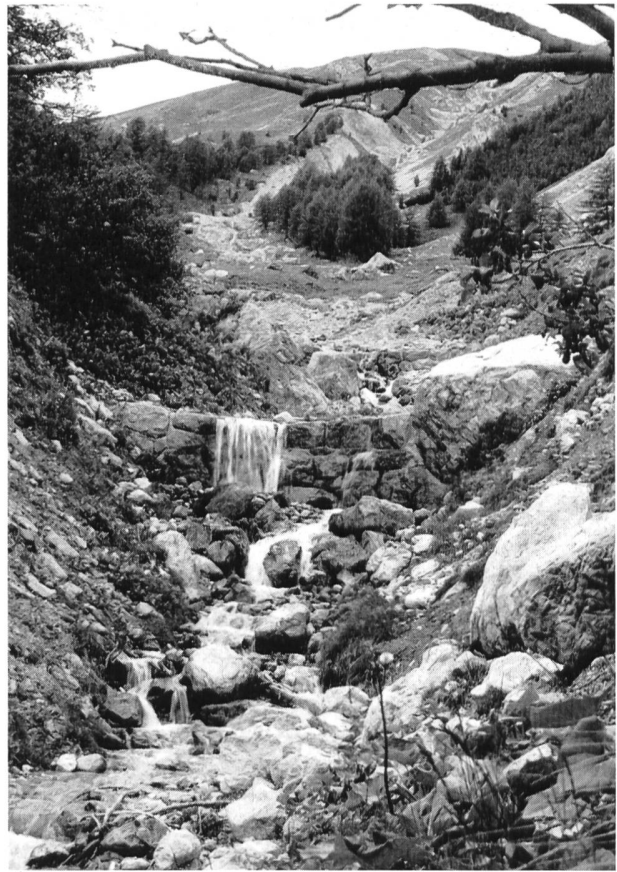
Bilder 24 und 25 Hochwassersperrn in Trockenmauerwerk in Val Zuondra ob Celerina. Dieses stark erodierte Wildbachtobel — ein Seitental des vom Schlattainbach durchflossenen Val Saluver — stellt eine stete Bedrohung des stattlichen Dorfes Schlarigna/Celerina dar; nach den Verheerungen von 1944 wurden wieder kostspielige Verbauungen im Unterlauf des Schlattainbaches durchgeführt.

Vergleicht man diese Hochwassersperrn mit den von Prof. Dr. ing. R. Müller, ETH/Zürich, in seinem Bericht «Generelle Beurteilung der flussbaulichen Verhältnisse im Einzugsgebiet des Inn- oberhalb S-chanf» 2 theoretisch errechneten Hochwassersperrn, so könnte man den Schluss ziehen, dass das Verbauungsprojekt 1956 der Inn-Flaz-Korrektion für eine zu niedrige Hochwassermenge dimensioniert wurde. Dem ist aber nicht so.