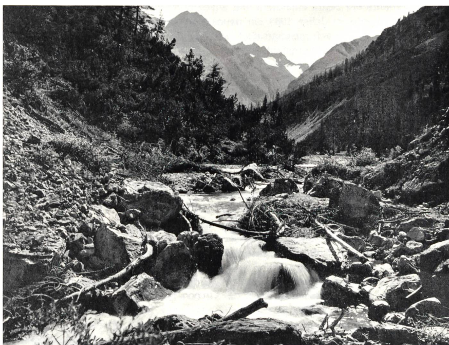
Bild 31 Die in wildem, unverbautem Bachbett zu Tale rauschende Clemgia in Val S-charl.

Nicht nur die grossen Verbauungen von Inn und Flaz im Oberengadin verursachten für die betreffenden Gemeinden grosse Sorgen und finanzielle Auslagen. Es waren von jeher die Seitenbäche des Inn, die bei Hochwasser immer wieder grosse Schäden anrichteten und verbaut werden mussten. Fast jede Gemeinde im Engadin hat auf ihrem Gebiet einen oder mehrere Wildbäche. Besonders in der zweiten Hälfte des letzten und anfangs dieses Jahrhunderts wurden die meisten Seitenbäche des Inn im Engadin verbaut. Im Einzugsgebiet wurden Sperren in Trockenmauerwerk erstellt, und auf den Schuttkegeln die Bäche kanalisiert und direkt in den Inn abgeleitet. Viele dieser Verbauungen sind noch heute in einem guten Zustand, andere wurden mit der Zeit teilweise zerstört und mussten erneuert werden.