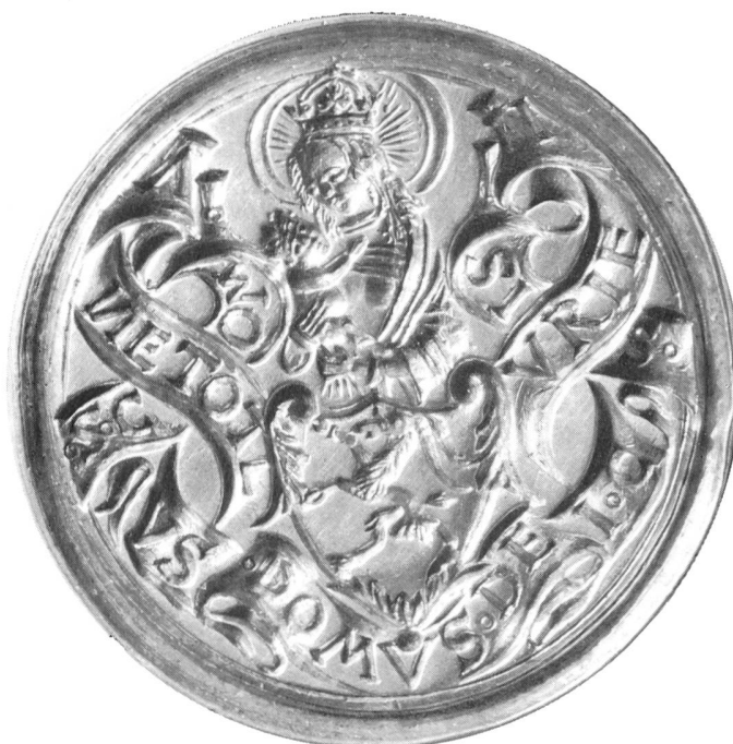
Bild 104 Altes Siegel des 1367 in Zernez und Chur geschlossenen Gotteshausbundes

Dies mahnt zum Aufsehen. Dies mahnt ebenso sehr wie jener Wald zuhinterst im Val S-charl. Es mahnt verhaltener. Sicher, jeder Mensch des 20. Jahrhunderts trägt ein wenig die Empfindung der «suldüm», der Verlassenheit, in sich. Doch im Rahmen der Geistesgeschichte und der Kultur des Engadins enthält diese Empfindung auch die deutliche Aufforderung, das Besondere, das Wesenhafte dieser Kultur, so weit dies erreichbar ist, in jener Frische zu erhalten, die ihr auch weiterhin ermöglicht, Neues in der ihrer Gemeinschaft eigenen Weise zu verarbeiten und zu formen.