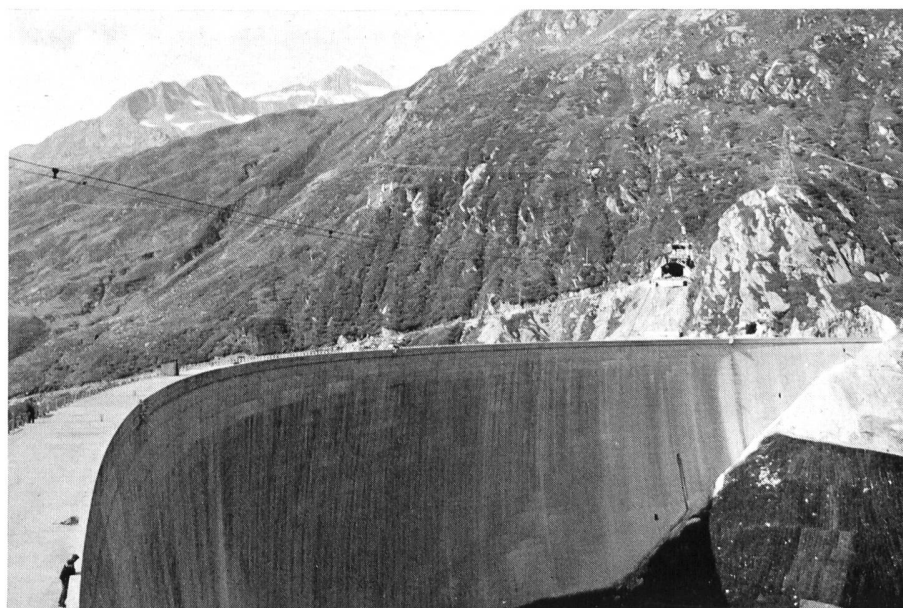
Bild 2 Talseitige Ansicht der Staumauer Sta. Maria am Lukmanierpass, Blick auf Piz Rondadura