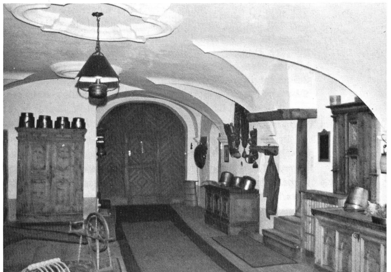
Bild 3 Engadiner Sulèr im Haus Pianto in Samedan.