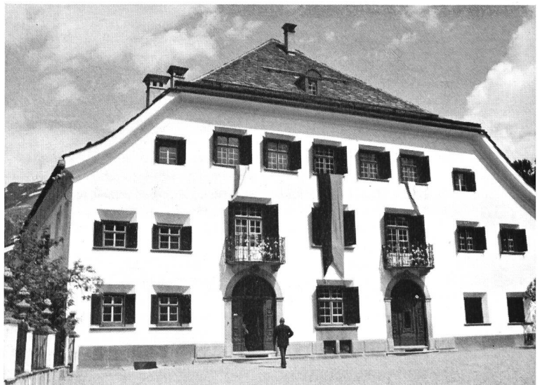
Bild 2 Chesa Planta, typisches Engadiner Patrizierhaus in Samedan, in welchem u.a. die romanische Bibliothek untergebracht ist.