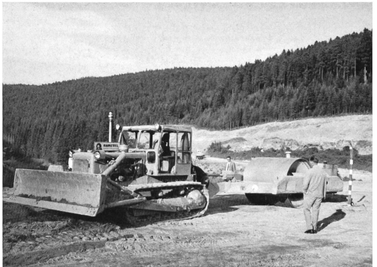
Bild 3 Grosse Walze auf dem nahezu vollendeten Erddamm der Nagoldtalsperre.