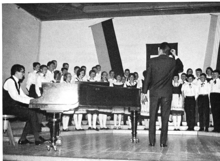
Bild 7 Frühlingsstrauss zur Begrüssung der Hauptversammlung SWV am 29. Juni 1967.