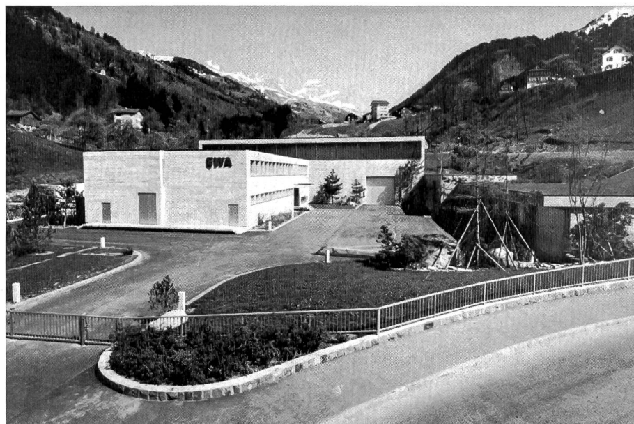
Bild 2 Zentrale Bürglen im Schächental; Blick gegen den Klausenpass und auf die Schächentaler Windgälle

miteinbezogen. Ferner werden die Abflüsse des Sulztalbaches direkt in den Druckstollen eingeleitet. Die Stufe Unterschächen-Bürglen verfügt über zwei Maschinengruppen. Das zwischen Unterschächen und Loreto anfallende Restwasser wird in einem Nebenwerk, in der Anlage Loreto-Bürglen, genutzt. Die Maschinengruppe dieser Stufe befindet sich ebenfalls in der neuen Zentrale. Eine Unterstation mit einer 15 kV- und 50 kV-Innenraum-Schaltanlage ist dem Kraftwerk Bürglen angegliedert. Sie übernimmt die Funktion der Verteilung der elektrischen Energie im Raum Alt-