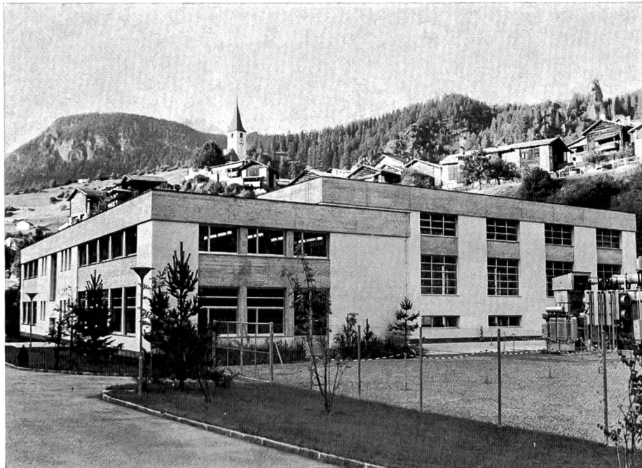
Bild 7 Zentrale Filisur und Dorfpartie