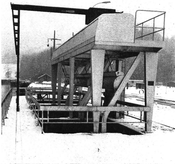
Kühlwasserfassungen der Atomkraftwerke Beznau I + II Je 3 Rechen und automatische, stationäre Rechen-Rei- nigungsmaschinen