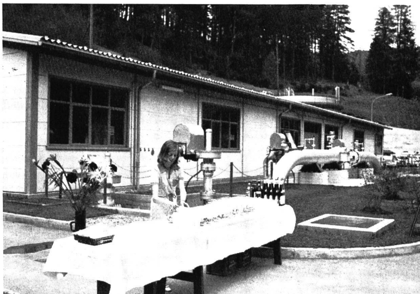
Bild 5 Teilansicht der Druckreduzier-Station Rongellen