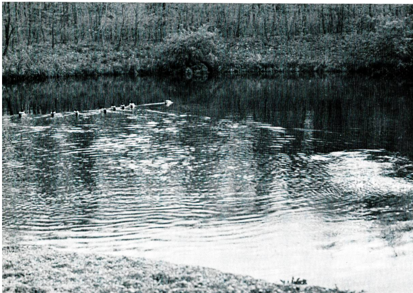
Bild 2b Sickerweiher der Hardwasser AG in der Muttenzer Hard mit Rundkiessohle, Wassertiefe ca. 3 m.

benachbarten Hafen- und Industriearealen von den Entnahmebrunnen fernzuhalten, muss die Infiltrationsmenge genügend gross sein. Die Erfahrung hat gezeigt, dass beim Hardwerk 50 bis 60 Prozent der infiltrierten Wassermenge als Trinkwasser zurückgewonnen werden können. Das in den Entnahmebrunnen gewonnene Grundwasser wird in ein zweikammeriges Sammelreservoir mit einem Inhalt von 5000 m 3 an der westlichen Peripherie der Hard gefördert, wo es den beiden Kantonen für die Weiterleitung in ihre Verteilnetze zur Verfügung steht. Der heutige Ausbau der Hardanlagen ist so weit fortgeschritten, dass mit insgesamt 30 Entnahmebrunnen bis 140 000 m 3 Trinkwasser pro Tag gefördert werden können. Im Endausbau wird eine Förderleistung von ca. 150 000 m 3 pro Tag erwartet.