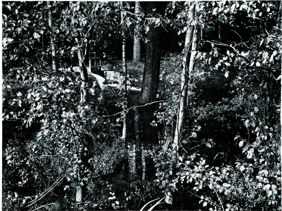
Bild 1 Flächenversickerung im bewaldeten Teil der Schutzzone Lange Erlen, Wassertiefe bis 40 cm.

Um die Förderleistung unabhängig von der Witterung und der Wasserführung der Wiese in quantitativer und qualitativer Beziehung dauernd auf der vollen Kapazität zu halten, wurde ein Projekt ausgeführt, welches die Infiltration von vorgereinigtem Rheinwasser statt unbehandeltem Wiesewasser ermöglicht. Die Rohwasser-Pumpanlage entnimmt das Wasser aus dem Rhein auf dem rechten Ufer der Stauhaltung des Kraftwerks Birsfelden. Durch zwei Schleuderbeton-Rohrleitungen mit einem Durchmesser von 1 m gelangt das Rohwasser in die Schnellfilter-Anlage in der Nähe des Erlenpumpwerks. Die Schnellfilter-Anlage besteht aus 10 Doppelfiltern mit je 100 m 2 Filterfläche. Bei der normalen Filtergeschwindigkeit von 5 m pro Stunde beträgt die tägliche Durchsatzleistung 120 000 m 3 . Das filtrierte Rheinwasser fliesst in ein Reservoir mit einem Inhalt von 2000 m 3 , von wo das Filtrat nach den Sickerstellen in der Schutzzone gepumpt wird. Die Rheinwasserinfiltrationsanlage konnte im Mai 1964 in Betrieb genommen werden.