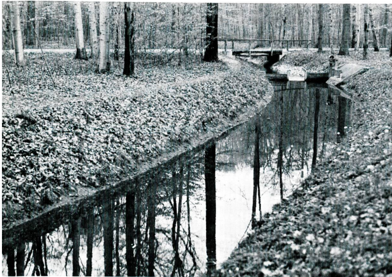
Bild 2a Sickergraben der Hardwasser AG in der Muttenzer Hard Sohlenbreite 2 m, Rundkiessohle 40 cm hoch, Körnung 5 bis 10 mm, Wassertiefe ca. 80 cm.