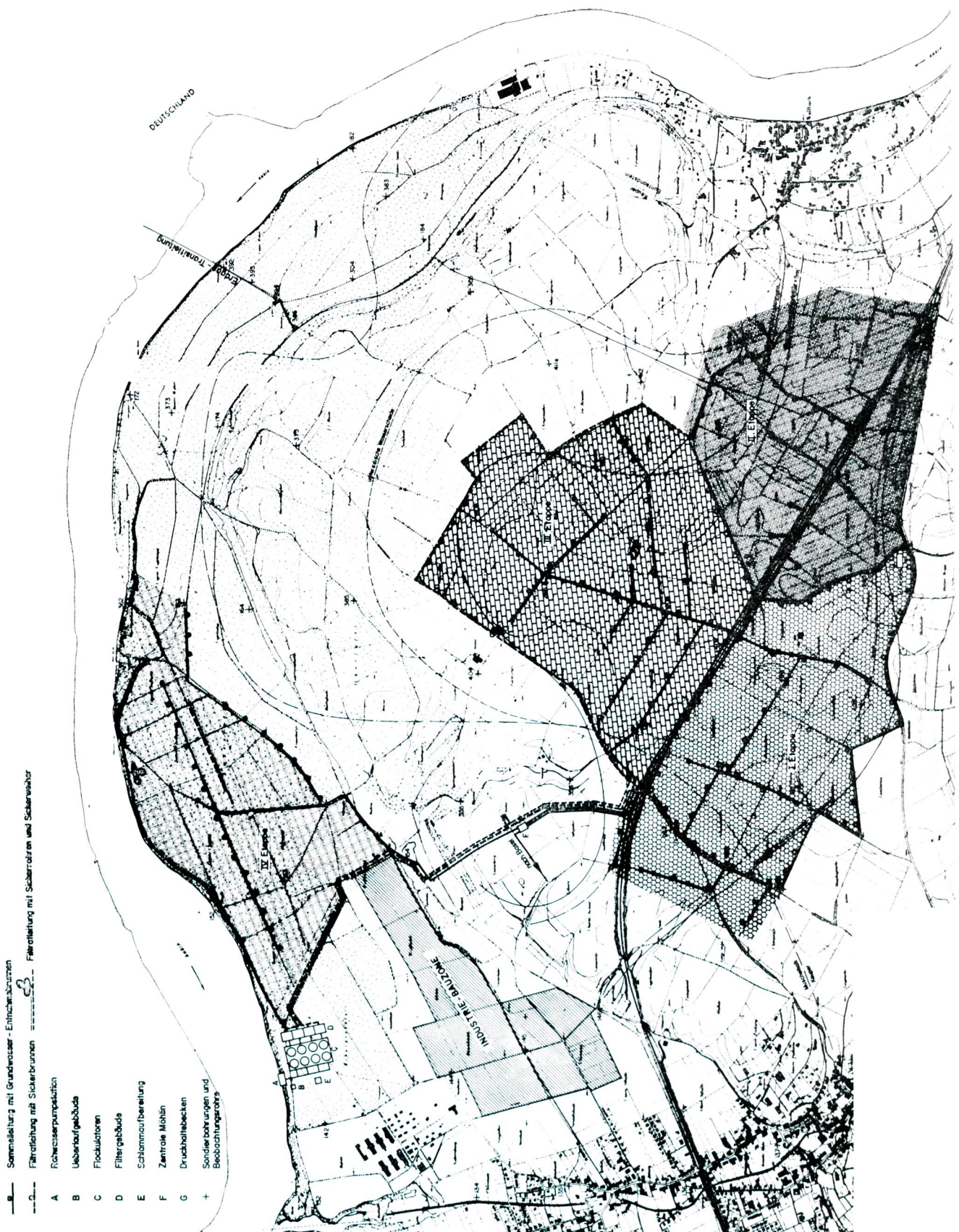
Bild 3 Generelles Projekt des Grundwassergewinnungswerks bei Möhlin. Lageplan 1:25 000, Bautappen I bis IV (Plan Gas- und Wasserwerk Basel).