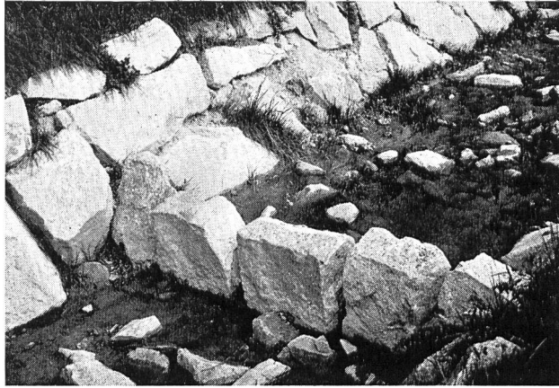
Bild 1 Egliswilerbach. Böschungssicherung mittels unverfugtem Blockwurf; Natursteinschwelle in der durchlaufenden Bachsohle.

Dagegen bedeutet schon der Ersatz der früher oft sehr glatt verlegten Pflasterungen und der Betonmauern durch den rauhen Blockwurf zweifelsohne einen wesentlichen Schritt zu grösserer Naturnähe, was auch von den Anliegern im allgemeinen anerkannt wird. Der Schutz des Menschen und seiner Behausungen verlangt zwei Massnahmen an den Gewässern, die eigentlich der Natur zuwiderlaufen, nämlich ein auch für Hochwasser genügend grosses Bachbett und die Standfestigkeit seiner Sohle und Böschungen gegen den Angriff des Wassers. Dies in einer Art und Weise zu erreichen, dass das neue Gerinne nach kurzer