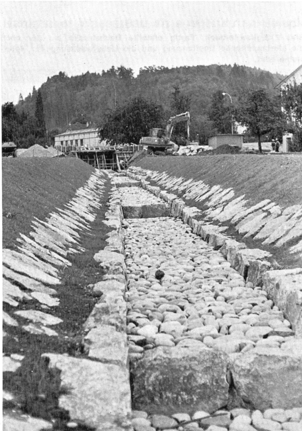
Bild 5 Fisibach. Die Natursteine halten durch ihr Gewicht dem Angriff des Wassers stand; sie müssen deshalb nicht zusammenwirken. Die Fugen können gross sein und offen bleiben; sie dienen als Unterschlupf für Fische und Ansatzfläche für den Bewuchs.