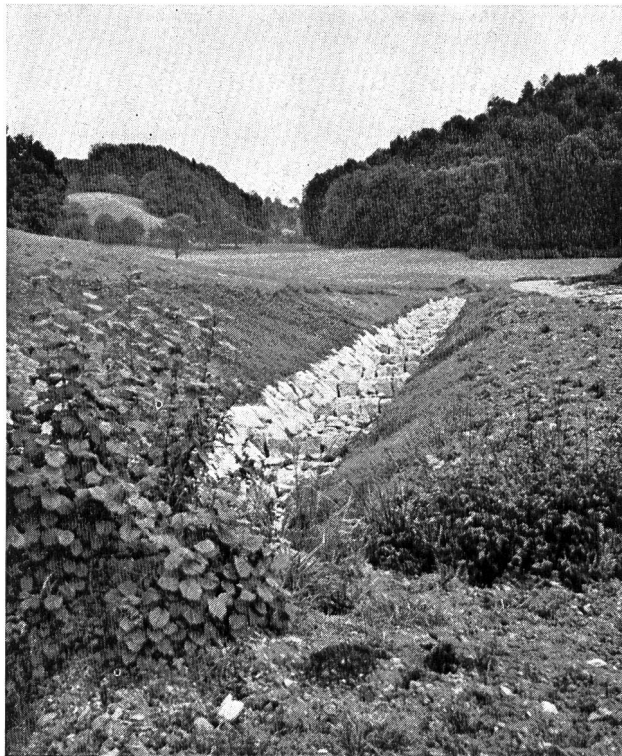
Bild 2 Egliswilerbach. Fertig erstellte Bachstrecke, an der noch die uferbegleitende Bepflanzung und die Ueberwachung der Natursteine fehlt.

Zum Schluss liegt die Frage nahe, welche Vor- und Nachteile zwischen den früheren Verbauungen und der heutigen naturnäheren Bauweise sich gegenüberstellen. Im wesentlichen ist es wohl so, dass durch die geringere Fließgeschwindigkeit (Massnahmen der Fischerei) und durch die Verbauungsart (Blockwurf mit flacher Böschung) und die Anpassung der Linienführung an die Topographie, die Korrekturen etwas mehr kosten als die früher üblichen. Denn die früheren Korrekturen waren gekennzeichnet durch ihren gradlinigen Verlauf mit glatten und steilen Böschungen. Sie waren dementsprechend billiger in den Baukosten und im Landerwerb. Von Natur und Landschaft war wenig die Rede, denn das erste Bestreben bei den früheren Korrekturen war stets der Landgewinn. Der Vorteil der naturnahen Verbauung liegt darin — wie schon