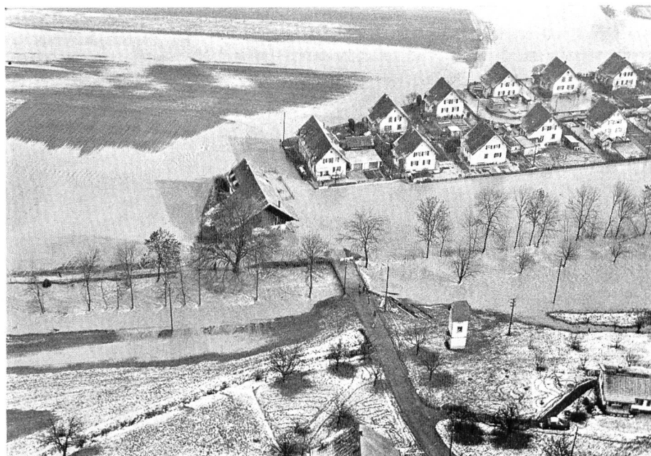
Bild 1 Brittnau-Hard. Ueberflutung der Wigger im Hard, Gemeinde Brittnau.

Infolge der Aufhebung bzw. Reduzierung bestehender Abstürze konnte das Längsgefälle bis auf 5 ‰ erhöht werden. Diese Gefällserhöhung bewirkt eine kleinere Wasserabflusstiefe und somit einen geringeren Gerinnequer-