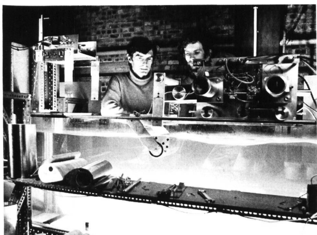
Bild 1. Die Flügel des «Nodding Duck System» werden im Labor erprobt.

15 m haben und 9 m lang sein. Sie werden zu einer Kette von etwa 500 m aufgereiht, die nicht zu nahe am Ufer, sondern bei einer Wassertiefe von mindestens 90 m verankert wird, damit die grossen Ozeanwellen ausgenützt werden können.