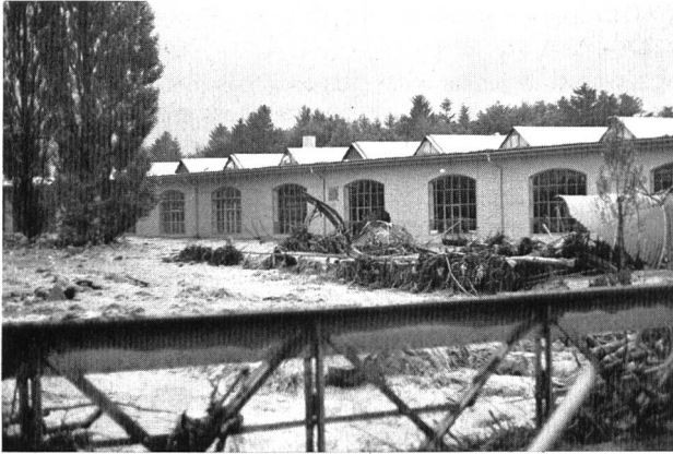
Bild 3. Unwetterkatastrophe: Der Fluss überläuft in das Industrieareal; Verschmutzungen jeder Art sind möglich.