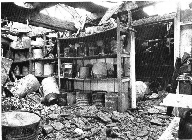
Bild 2. Nach dem Brand eines Textilwerkes: Durch eine vorschriftsgemäße und sichere Lagerung der Chemikalien kann eine Verschmutzung der Gewässer weitgehend verhindert werden.

Il est déjà sensiblement plus difficile d'identifier les risques, les pollueurs et les pollués dans le domaine de la loi sur la protection des eaux. Sans doute, la situation est-elle claire lorsqu'il s'agit de la protection directe de l'eau potable en tant que denrée alimentaire pour l'homme et les animaux. Mais, de grands efforts sont également consentis dans le cadre de la loi sur la protection des eaux pour obtenir une eau potable potentielle, même si peut-être, pendant longtemps, elle ne sera pas utilisée comme telle. Les lésés éventuels sont déjà les générations futures. Il est bien plus difficile encore de chiffrer les dégâts et de nommer les lésés lorsqu'il s'agit de préserver les biotopes des microorganismes peuplant rivières et lacs.