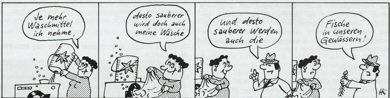
Schweiz. Vereinigung für Gewässerschutz und Lufthygiene Aktion Saubere Schweiz

Les bandes dessinées publiées par la LSPEA et la Ligue pour la propreté en Suisse paraissent depuis deux ans dans un nombre sans cesse croissant d'organes de publication.