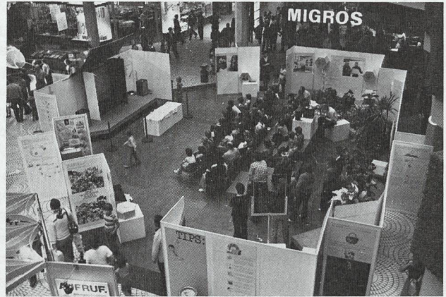
Ein Blick ins stets gut besuchte Filmforum.

Die Umweltschutz-Organisationen stehen vor der undankbaren Aufgabe, der Bevölkerung immer wieder die gleichen Empfehlungen in Erinnerung zu rufen, um ständig weitere Kreise zu motivieren und zur Beachtung wichtiger Massnahmen und Verhaltensregeln zu gewinnen. Zeitungen und Zeitschriften ihrerseits müssen ihren Lesern aktuelle Informationen und Nachrichten vermitteln und sind daher an Wiederholungen gleicher oder ähnlicher Umweltschutz-Informationen nicht besonders interessiert. Für eine optimale Zusammenarbeit mit der Presse musste daher eine neue Form gefunden werden: die Comic-Strips. Die von der VGL und der ASS seit zwei Jahren gemeinsam herausgegebenen Zeichnungsserien fanden ein grosses Echo und werden von einer ständig wachsenden Zahl von Publikationsorganen zum Abdruck übernommen.