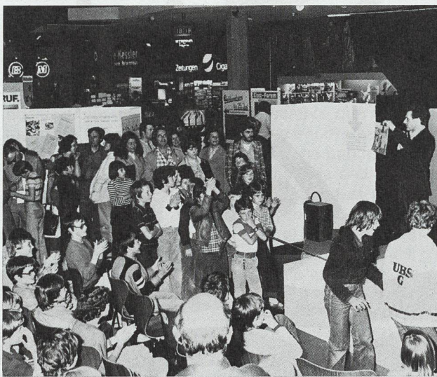
Die Jugend lässt sich für den Umweltschutz noch begeistern (wie hier bei einem Zeichnungs-Wettbewerb).

Auf dem Tätigkeitsgebiet der Aufklärung und Erziehung wurden gemeinsam mit der Aktion Saubere Schweiz, ASS, ebenfalls zwei Arbeitsgruppen ins Leben gerufen. Die Arbeitsgruppe «Schule und Umweltschutzerziehung», in der Fachleute, Graphiker und Gestalter sowie vor allem Lehrer verschiedener Schulstufen mitarbeiten, ist nach eingehenden Vorabklärungen heute daran, Arbeitshilfen und -unterlagen für Lehrer zu entwerfen und auszuarbeiten.