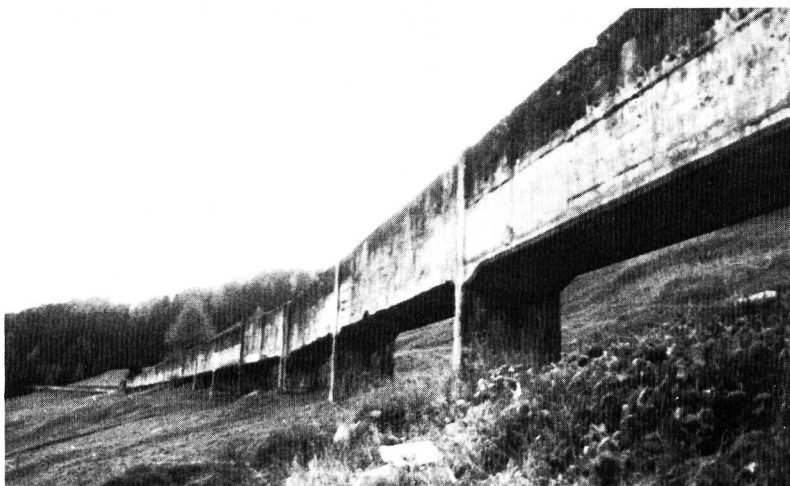
Bild 1, links. Die Triebwasserleitung Heidsee—Obervaz, die seit Januar 1977 ausser Betrieb ist, wird abgebrochen. Aufnahme vom 22. Oktober 1977 bei Koordinate 761.600/175.650. Die Aussenmasse des Kanals sind: Höhe rund 1,8 m; Breite 1,45 m. Der Stützenabstand beträgt etwa 8 m.

(Aus «Industriearchäologie, Zeitschrift für Technikgeschichte» 4/1978, S. 2)