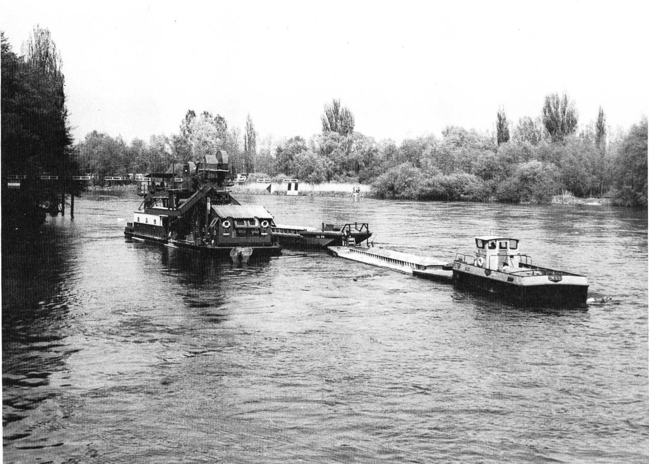
Bild 2. Blick rheinaufwärts auf das Baggerschiff (links), das oberhalb der Rüdlingerbrücke Kies herausbaggert und auf das nebenan bereitliegende Transportboot lädt. Rechts aussen wird ein vollbeladenes Transportboot weggeschoben.