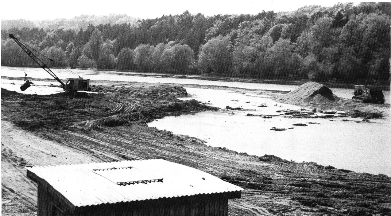
Bild 1. Baggerung im Rhein bei der Thurmündung. Der Rhein fliesst von rechts nach links. Mit einem Schürfkübel-Bagger (links) wird das von der Thur in den Rhein gebrachte Geschiebe herausgenommen.

Ähnliche Probleme wie bei der Thurmündung zeigen sich auch beim Zusammenfluss von Töss und Rhein bei der