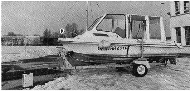
Bild 4. Messboot der Electricité de France, EDF. Am Boden links: Fixpunkt zur Standortbestimmung.

Schuten erfolgt nach zwei verschiedenen Methoden, je nachdem das Baggergut in den Strom verklappt oder auf eine Deponie gebracht wird.