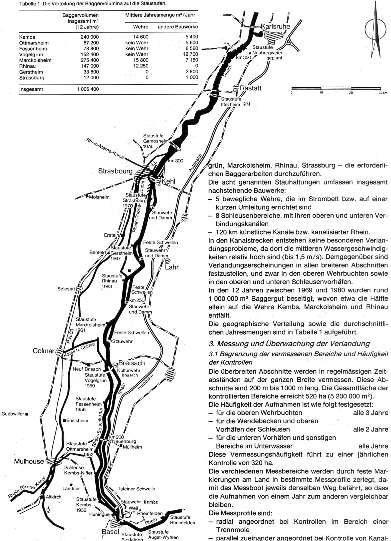
Bild 1. Übersichtskarte über die Rheinkraftwerke zwischen Basel und Strassburg.

grün, Marckolsheim, Rhinau, Strassburg – die erforderlichen Baggerarbeiten durchzuführen.