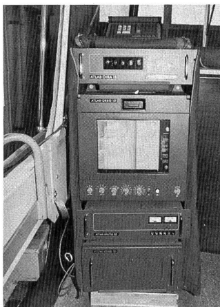
Bild 5. Das Echolot-Gerät ist im Messboot der EDF eingebaut.

Der Beitrag ist (in französischer Sprache) in den Mitteilungen der Versuchsanstalt für Wasserbau, Hydrologie und Glaziologie an der ETHZ, Nr. 53, enthalten. Dort finden sich auch alle übrigen an der Tagung gehaltenen Referate.