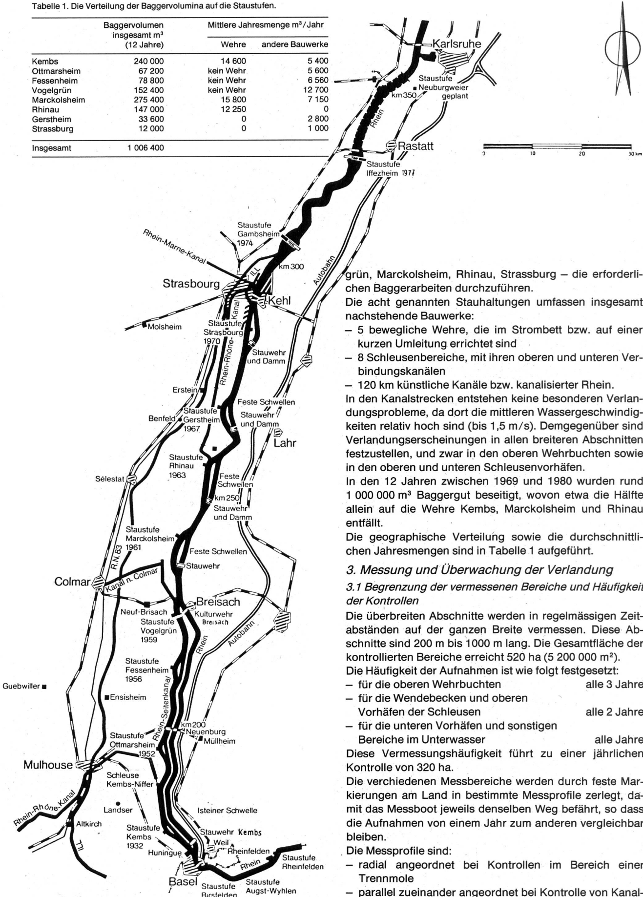
Bild 1. Übersichtskarte über die Rheinkraftwerke zwischen Basel und Strassburg.

grün, Marckolsheim, Rhinau, Strassburg – die erforderlichen Baggerarbeiten durchzuführen.