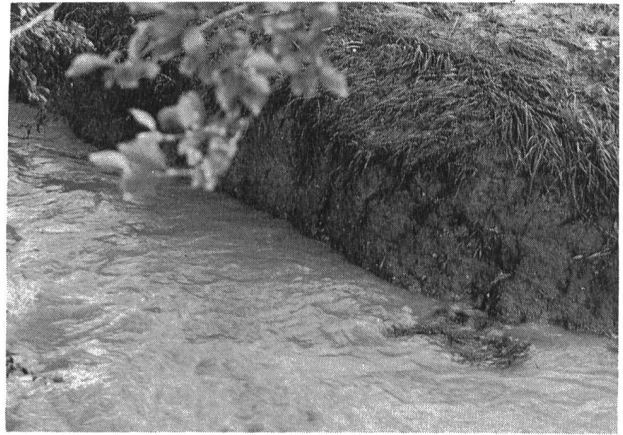
Bild 3. Prallufer eines kleinen Baches nach einem Hochwasser. Die Stelle kann mit verhältnismässig kleinem Aufwand durch den Wuhrmeister repariert werden. Schon nach dem nächsten Hochwasser wird das nicht mehr möglich sein. Der Schaden wird nach kurzer Zeit soweit fortgeschritten sein, dass schon bald systematische Verbaubarbeiten notwendig werden.

Es lohnt sich nicht, Unterhaltsarbeiten so lange hinauszuschieben, bis mit Subventionen grössere Verbaubarbeiten, oft mit der Bezeichnung «Rekonstruktion», ausgeführt werden können.