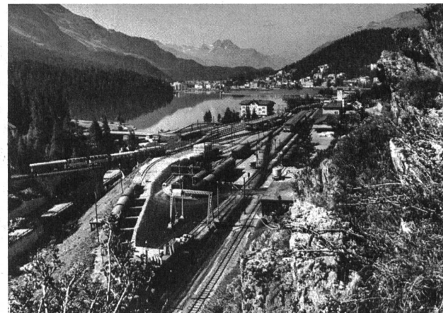
Bild 2. Der St. Moritzersee um 1980 nach der Entwicklung zum Weltkurort.

Entsprechend der obgenannten Zielsetzung, die Wandlung des Sees aus den Sedimenten zu erkunden, wurde am 26. September 1978 ein 85 cm langer Bohrkern an der