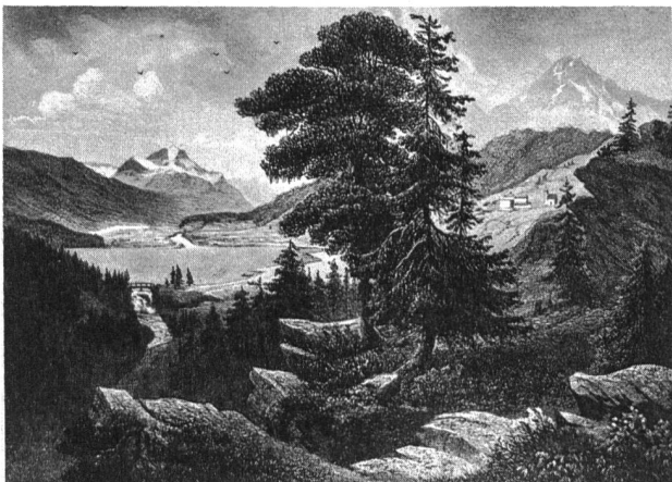
Bild 1. Der St. Moritzersee vor 1800, ein von der Zivilisation unberührter Bergsee.

resort changed from oligotrophy to eutrophy. The change is documented by limnological studies and is reflected in the sediment deposits by the stratigraphy of carotenoids, subfossil diatoms and in the composition of specific cladocera remains.