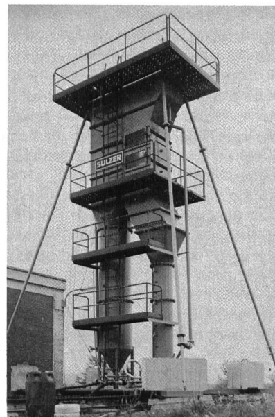
Bild 1. Pilotanlage zur Optimierung von Grossanlagen.

Einige wichtige Kriterien sind: Gesteigungs- und Montagekosten der kompletten Absetzvorrichtung, Oberflächenbelastbarkeit, Durchbruchsicherheit, Unempfindlichkeit gegen Belastungsschüsse, Chemikalienbedarf, Klarwasserqualität, Schlammkonzentration, gleichförmige Beaufschlagung der gesamten Schrägkläreinbauten sowie Universalität und Einfachheit. Nicht jede der drei erwähnten Prinzipien erfüllt alle diese Kriterien, so dass sich ein wirtschaftlicher Schrägklärer aus einem möglichst günstigen Kompromiss aller Kriterien ergeben wird.