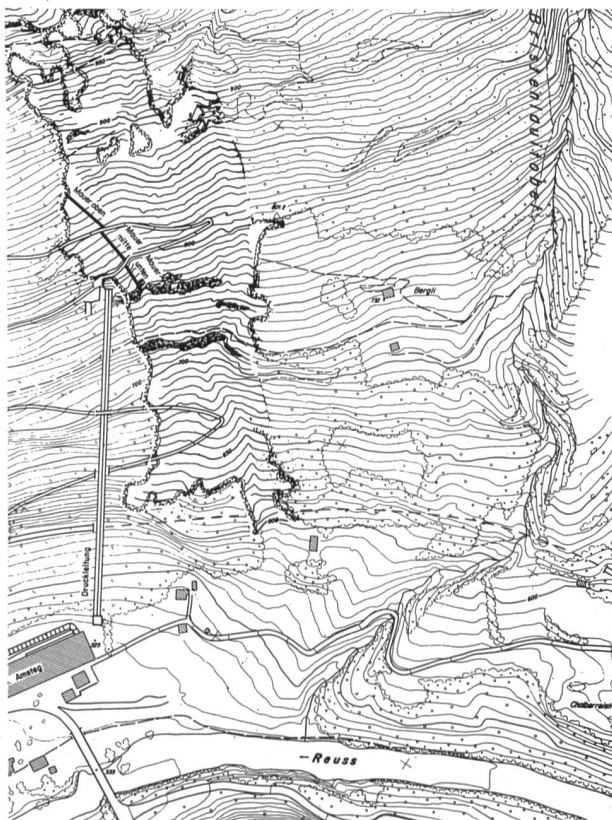
Bild 2, rechts. Situation mit den Ablenkmauern.