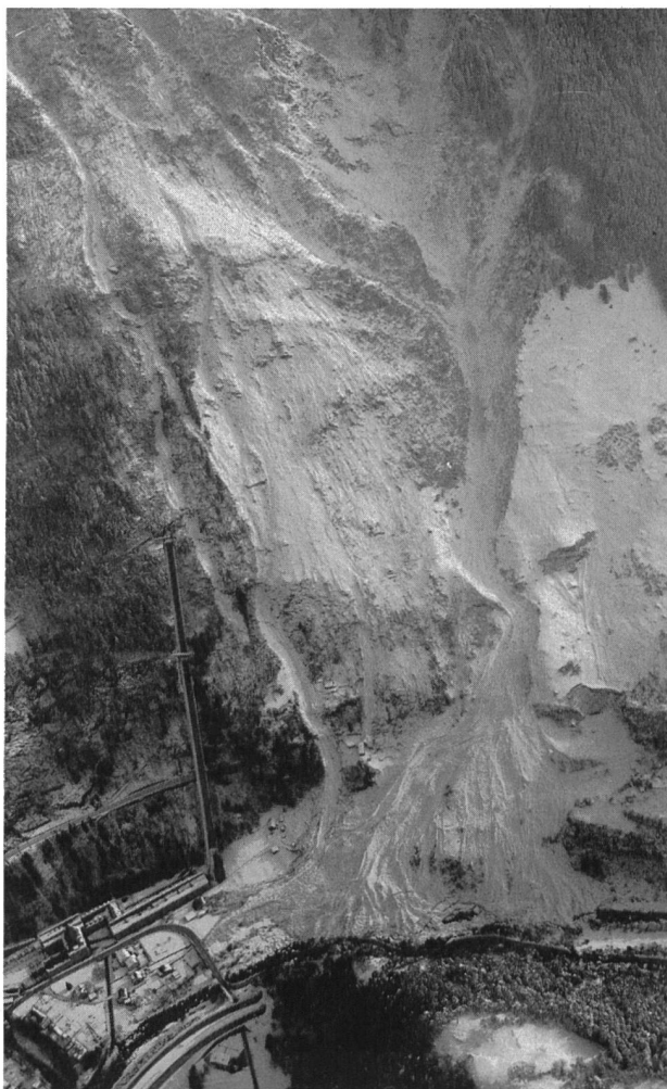
Bild 1, links. Luftaufnahme der Situation nach dem Lawinenniedergang vom 2./ 3. Februar 1978. Rechts im Bild das Bristenlauritobel, in der Mitte die Druckleitungen und unten das Krafthaus. Die Gotthardstrecke führt über die Chärstelenbachbrücke (unten links) und verschwindet bei der Druckleitung im Bristentunnel, welcher 1975 aus zwei kürzeren Tunnels entstanden ist. Das 44,5 m lange Verbindungsrohr ist im Tagbau betoniert worden und liegt direkt unter dem Lawinenkegel.

An Ort und Stelle und vom Helikopter aus war die entstandene schwerwiegende Situation sofort zu erkennen (Bild 1). Durch die Zerstörung weiter Teile des Schutzwaldes waren nun zusätzliche offene Stellen entstanden, die das Anreissen von Sekundärlawinen begünstigten. Direkt gefährdet waren das Wasserschloss und der obere Teil der Druckleitungen. Daneben galt es aber auch, die Folgeschäden bei einem Bruch der Druckleitungen zu berücksichtigen; die ausfliessenden Wassermassen hätten nicht nur die Gotthardlinie und das Krafthaus, sondern auch Teile des Dorfes Amsteg in Mitleidenschaft gezogen. Es war sofort klar, dass die Realisierung wirksamer baulicher oder forstlicher Schutzmassnahmen längere Zeit beanspruchen würde. Man beschloss deshalb, im Falle erhöhter Lawinengefahr das Kraftwerk vorsorglich ausser Betrieb zu nehmen und die Drosselklappen zu schliessen. Diese Regelung galt in den Wintern 1978/79, 1979/80 und 1980/81.