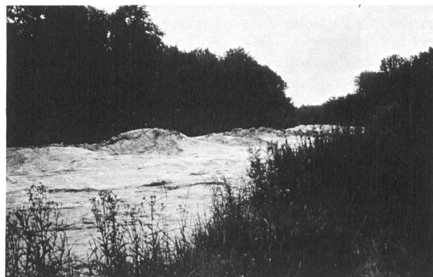
Bild 2. Das Flussbett der Emme oberhalb der Brücke Utzensdorf/Bätterkinden; Hochwasser vom 10.7.1977.

Il est fréquent que le débit de crue doive être estimé, car on ne dispose pas de mesures directes. On recourt alors à différentes méthodes, modèles, voire formules empiriques en faisant appel à des données enregistrées en un autre point