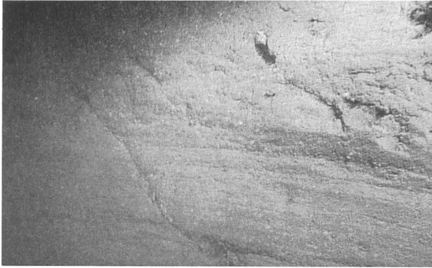
Bild 3. Horizontale Schliiffspuren des eiszeitlichen Gletschers an den Felswänden der Halbinsel von Betlis in etwa 50 m Wassertiefe. Bildhöhe etwa 1 m.

Die Steilheit des Geländes und die zum Teil stark erosionsanfälligen Einzugsgebiete prädestinieren diese Bäche dazu, ausgeprägte Bachkegel im See aufzubauen, die morphologisch markant in Erscheinung treten, sowohl oberflächlich (Murg, Flibach, Meerenbach) als auch subaquatisch (Rombach = «Muslenbach», Fulenbach, Geissbach usw.). Die ausgeprägteste Ausbuchtung formt der Kegel des Flibachs und dokumentiert damit die intensive Erosion im Einzugsgebiet dieses Wildbachs. Gegenwärtig sind umfangreiche Verbauungsarbeiten im Gang. Von 1931 bis 1979 wuchs der Schuttkegel des Flibachs um rund 450 000 m 3 .