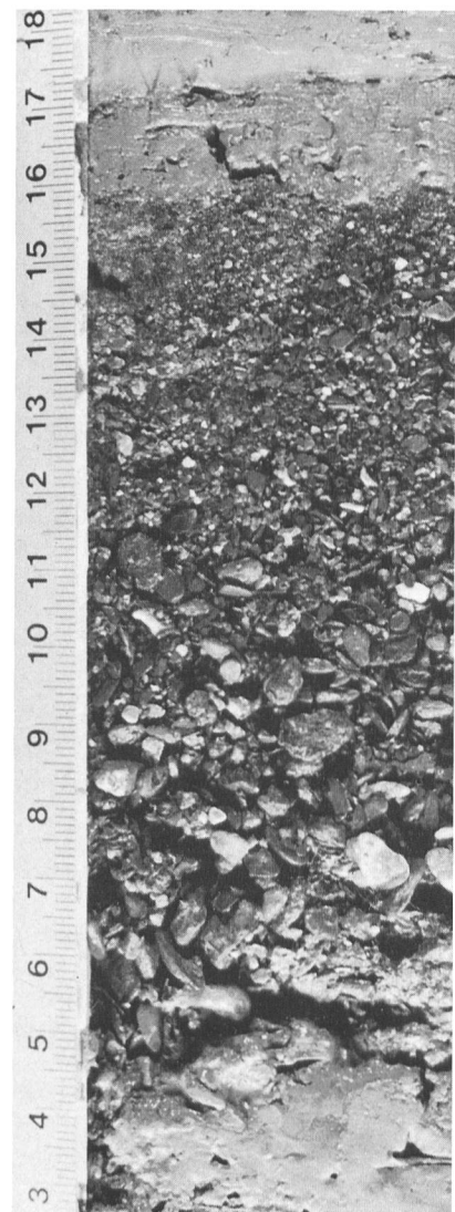
Bild 4. Kiesige Zwischenschicht in den überwiegend feinkörnig aufgebauten Sedimenten der zentralen See-Ebene. Solche Einschaltungen dokumentieren murgangartige Ereignisse in den seitlich einmündenden Wildbächen (cm-Massstab).