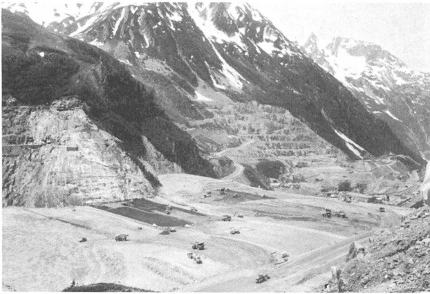
Grand'Maison in der Haute Savoie.

Beispiel einer französischen Pumpspeicheranlage mit Mehrwochensteuerung zur Überbrückung der stark temperaturabhängigen Nachfrage infolge elektrischer Raumheizungen. Das grosse Oberbeckenvolumen (142 Mio m 3 ) soll es erlauben, mehrmals im Winter Energieumwälzungen von einer Wärme- auf eine Kälteperiode (mehrere Tage bis einige Wochen) vornehmen zu können.