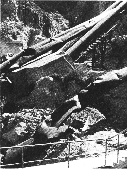
Bilder 3 und 4. Schwere Havarie einer zweisträngigen Druckleitung infolge eines unzulässig hohen Druckstosses, verursacht durch einen unkorrekt schliessenden Kugelschieber. Eine Zustandsbeurteilung, die auch die Beanspruchung von seiten der übrigen Systemkomponenten erfasst, kann solche Ereignisse verhindern.