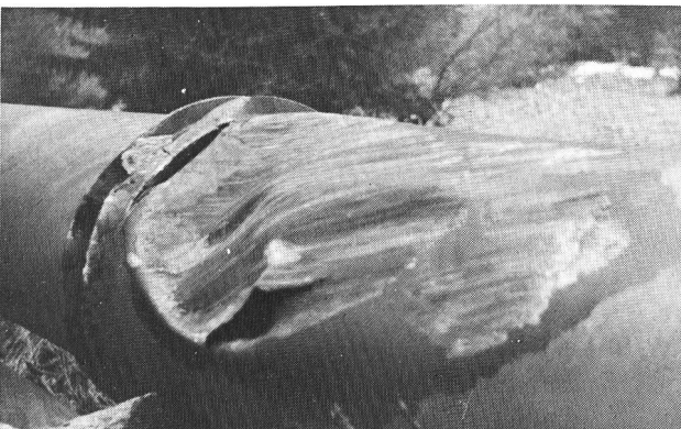
Bilder 5 und 6. Steinschlagschäden an einer Druckleitung. Im Fall von Bild 5 wurde eine 40jährige Druckleitung betroffen; im relativ spröden Material erfolgten Risse. Die Druckleitung Bild 6 aus zähem Material überstand vergleichbaren Steinschlag soweit, dass sie bis zum Auswechseln des Rohrstückes weiterbetrieben werden konnte.

Werner Roth , dipl. Stahlbau-Ing., Leitender Ingenieur Gruppe Stahlwasserbau, Motor-Columbus Ingenieurberatung AG, Parkstrasse 27, CH-5401 Baden.