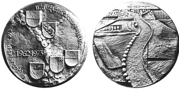
Bild 4. Gedenkmedaille für die II. Juragewässerkorrektion 1962–1973, Durchmesser 50mm.

Baukommission der II. Juragewässerkorrektion herausgegeben) einlässlich berichtet. Vielleicht ist es aber doch nützlich darauf hinzuweisen, dass die Korrektionsarbeiten erst anliefen, als die eidgenössischen Räte 1960 den «Bundesbeschluss über die Gewährung eines Bundesbeitrages» von 50% genehmigt und die Kantone 1961 ihre entsprechenden Beiträge gutgeheissen hatten – nämlich Bern, Neuenburg und Solothurn in einem Volksbeschluss und die Waadt und Freiburg in einem Grossratsbeschluss. Diese breite politische Abstützung verlangte von Robert Müller zwangsläufig eine grosse Informationsarbeit in zahlreichen Gremien und Volksversammlungen. Sie brachte ihn auch dazu, auf viele lokale Wünsche einzugehen, wobei er einen für die damalige Zeit bemerkenswerten Sinn für ökologische Anliegen entwickelte. So beschränkt er nicht nur in vielen technischen Dingen neue Wege, sondern auch hinsichtlich der Landschaftsgestaltung und der Fischerei. Nachhaltig unterstützte er zudem die baubegleitenden archäologischen Grabungen, die eine Fülle von keltischen und römischen Funden zeitigten.