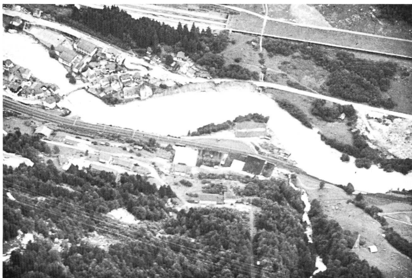
Bild 4. Ufererosionen durch Verlagerung von Mäanderbögen bei Gurtellen.