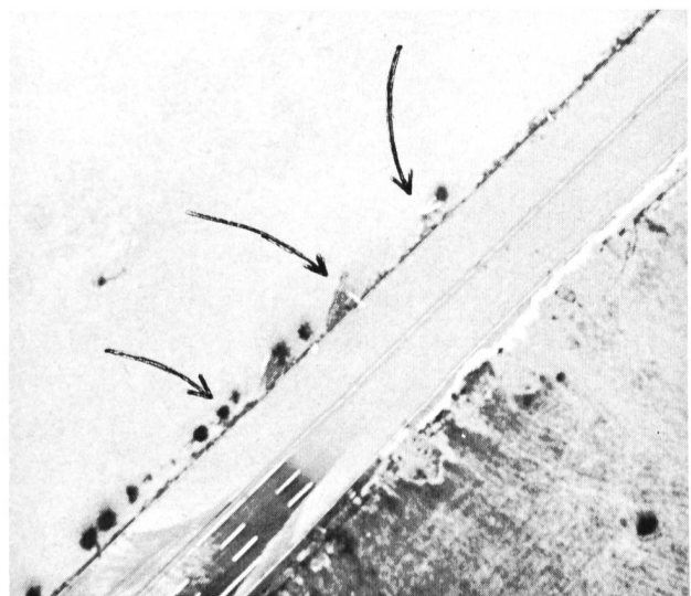
Bild 6. Überströmen des Autobahndamms bei Seedorf am 25. August 1987.

Neben der Planung des Gewässerausbau aufgrund der Wahl einer Dimensionierungswassermenge muss untersucht werden, welche Folgen das Überschreiten dieser Ausbaugrösse mit sich bringt. Können die Schäden nun für noch grössere Wassermengen durch geeignete Massnahmen einigermaßen begrenzt werden, so spielt die genaue Zuordnung einer Auftretenswahrscheinlichkeit respektive des Restrisikos eine untergeordnete Rolle. Bei Planung der zusätzlichen Massnahmen kann berücksichtigt werden, dass meist grosse Flächen diesen selten auftretenden Wassermengen zur Verfügung stehen.