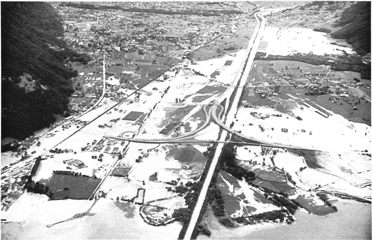
Bild 2. Überflutung der Reussebene am 25. August 1987.