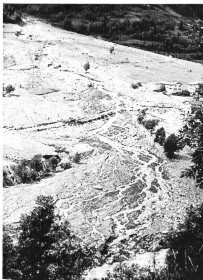
Bild 3. Murgangablagerungen am Ausgang des Val Varuna oberhalb Poschiavo.