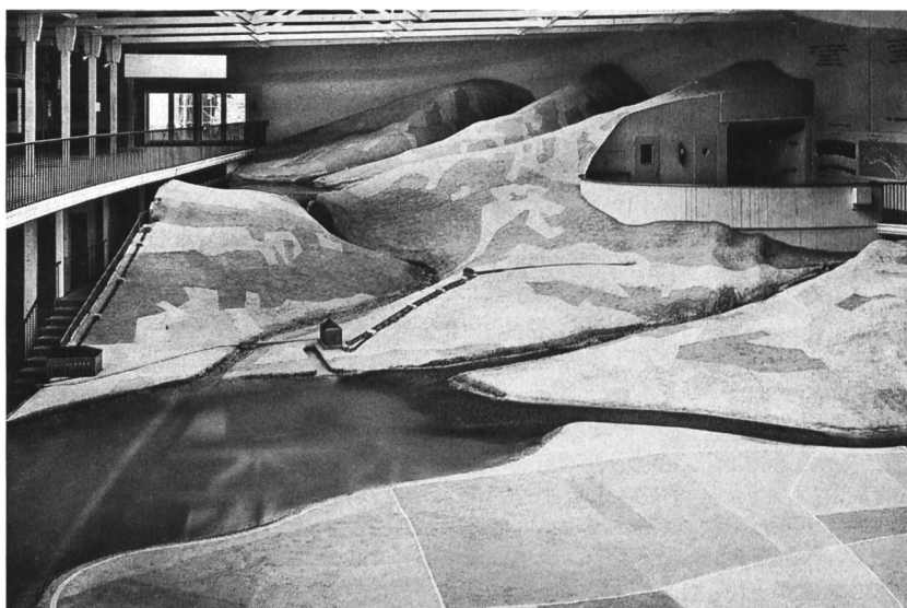
Bild 1, links. Das Wasserbaumodell 1:50 an der Landesausstellung 1939. Links ein Hochdruckspeicherwerk, in der Mitte ein Mitteldrucklaufwerk, rechts zwei geschlebeführende Wildbäche, die im See ein Delta bilden.

Die überbaute Grundfläche der Halle Elektrizität beträgt 5000 m 2 , die Ausstellungsfläche (inbegriffen Hof mit 47 m