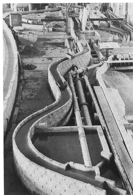
Bild 3, links. Sektion Erzeugung mit Exponaten der Schweizer Industrie: Turbinen, Generatoren, Druckleitungen und Abschlussorgane. Schifflibach: Länge 1800 m, Fliessgeschwindigkeit 1,4 bis 1,6 m/s, maximale Förderkapazität 1080 Personen pro Stunde (Foto Ringier Dokumentationszentrum).