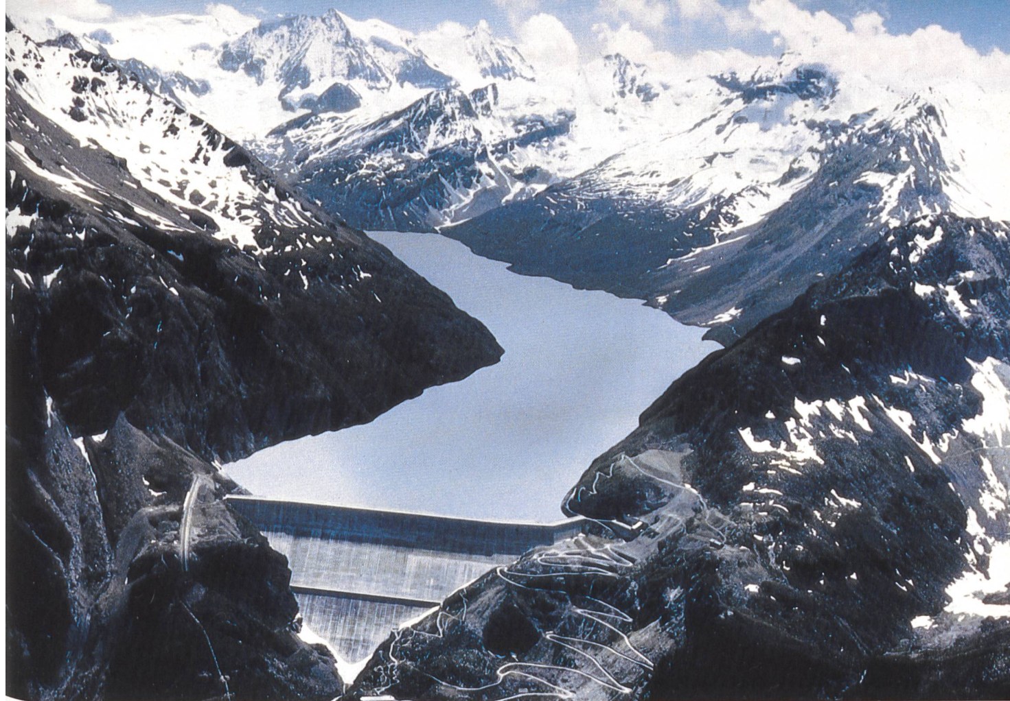
Flugaufnahme der 285 m hohen Gewichtsmauer der Grande-Dixence AG mit dem Stausee. Das Nutzvolumen beträgt 400 Mio m 3 . Für eine optimale Nutzung des Wassers legte die Grande-Dixence AG das Projekt Cleuson-Dixence vor, das auf Seite 2f. beschrieben ist.