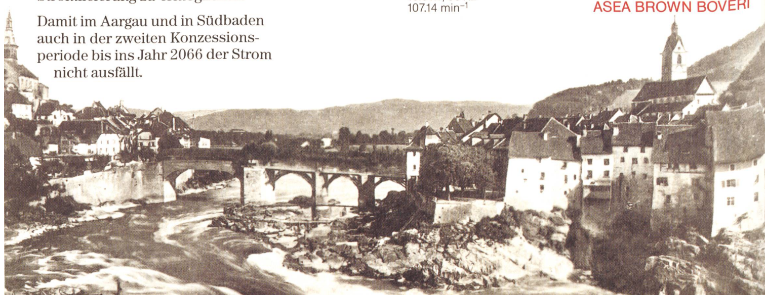
ABB ASEA BROWN BOVERI

Damit im Aargau und in Südbaden auch in der zweiten Konzessionsperiode bis ins Jahr 2066 der Strom nicht ausfällt.