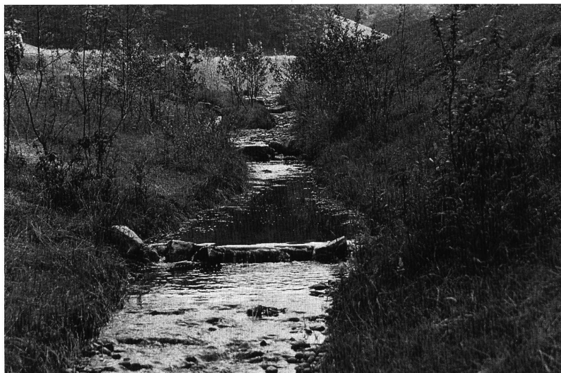
Bild 1, links. Makabre Illustration zur chinesischen Weisheit: «Das Wasser kann ohne Fische auskommen, aber kein Fisch ohne (gesundes) Wasser».