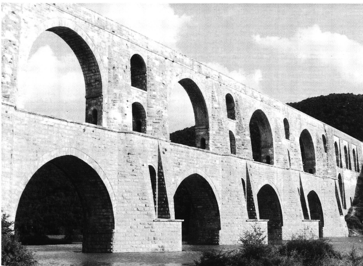
Bild 3: Der Maglova-Aquädukt an der Kirkçeşme-Leitung nach Istanbul.

der Osmanen (bis zur Eroberung Istanbuls 1453). Um 1530 erstellte Sinan die 26 km lange Wasserleitung von Norden, der er später eine 15 km lange Zuleitung von weiter östlich gelegenen Quellen zufügte (Bild 1, links). Einschliesslich aller Sekundärkanäle mass das System rund 50 km. Die Hauptleitung war gemauert und wies ein überwölbtes Lichtraumprofil von 0,35 m Breite und 0,70 m Höhe auf. Sie vermochte etwa 3000 m 3 /Tag zu fördern. Rund 3,8 km der Leitung verliefen in fünf Stollen und 0,5 km auf zwölf Aquädukten, von welchen der 105 m lange bei Yedigöz der bedeutendste war (Bild 2).