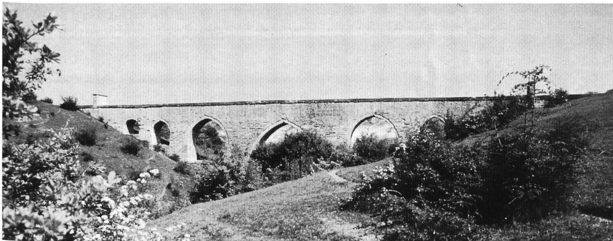
Bild 2: Der Yedigöz-Aquädukt an der Wasserleitung nach Edirne.

Anlässlich des vierhundertsten Todesjahres (1988) von Sinan veröffentlichten die Wasserbauprofessoren Kâzım Çeçen (Istanbul) und Ünal Öziş (Izmir) teilweise reich ausgestattete Monographien über dessen Wasserversorgungen, die demnächst auch in englischer Sprache erscheinen sollen [3, 4].