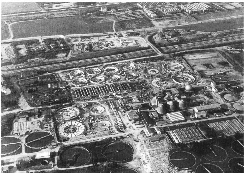
Bild 1. Blick auf die im Bau befindliche 2. Stufe des Klärwerks München I, Biologische Reinigungsanlage (Mitte), die Bundesautobahn München-Nürnberg und die Hilfsbrücke darüber zur Baustelleneinrichtung (Freigegeben Reg. v. Obb. G4/M10516C).

Die Erweiterung um eine zweite biologische Reinigungsstufe umfasst im wesentlichen den Neubau von acht rechteckigen Belebungsbecken (45 x 24 m) und sechzehn Rundbecken mit 43 m bzw. 61,50 m Aussendurchmesser zur Nachklärung in zwei Stufen, ein Maschinenhaus und