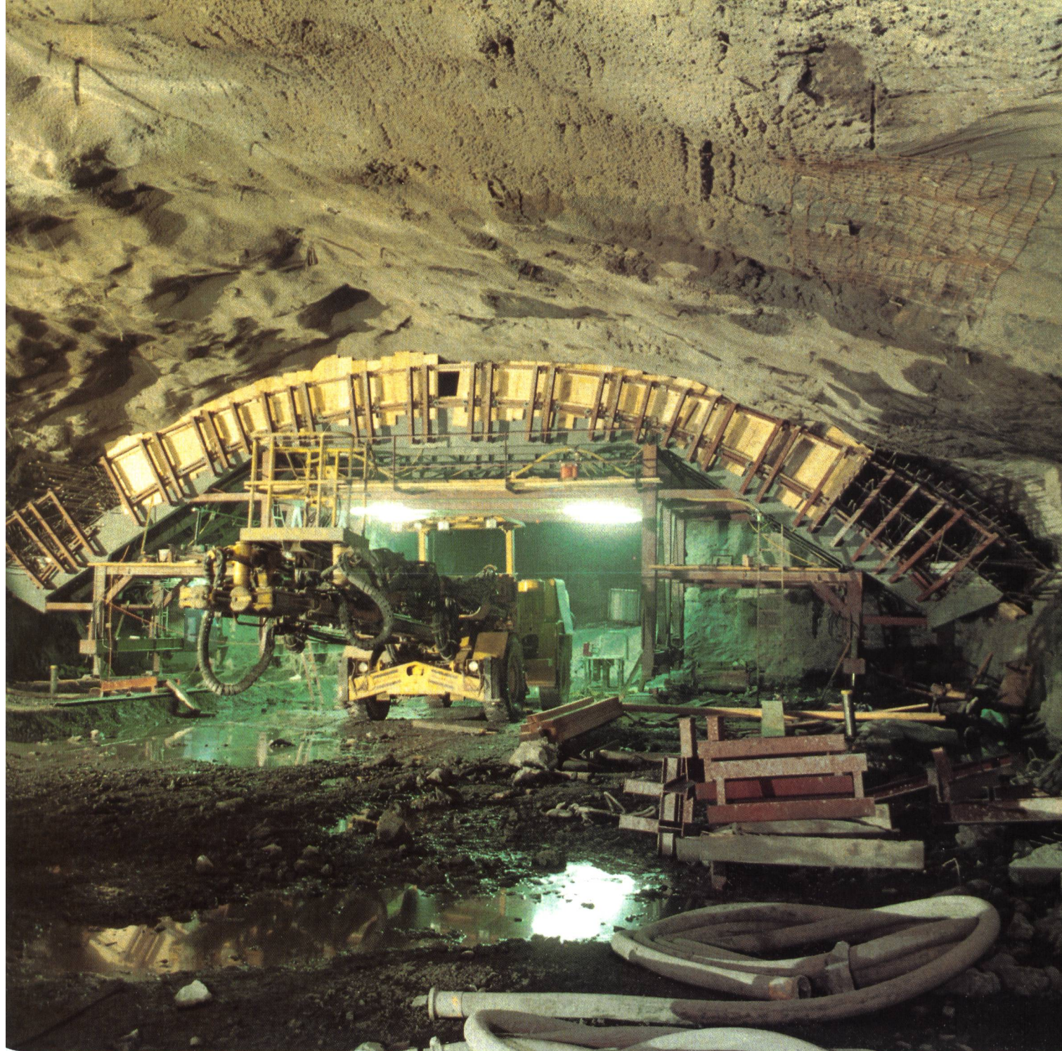
Kavernenzentrale Unteraa. Schalungen für die Betonverkleidung der Kalotte.