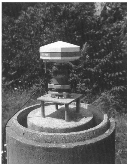
Bild 3. Zentriersystem für hochpräzise GPS-Messungen.

Die Messungen vom Juli 1992 erfolgten bei guten Satellitenkonstellationen. Praktisch während der ganzen Messzeit standen mindestens fünf Satelliten zur Verfügung. Um die für die angestrebte Präzision nötige Messdauer für zukünftige ähnliche Messungen zu ermitteln, wurde je in einem zweistündigen, einem einstündigen und einem halbstündigen Fenster gemessen. Die Auswertung erfolgte mit dem SKI-Softwarepaket von Leica, das auf der Auswertesoftware des Astronomischen Institutes der Universität Bern beruht und eine speditiv, stark automatisierte Berechnung erlaubt. Die gesamten Auswertearbeiten konnten in einem halben Tag abgeschlossen werden. Die Messungen der verschiedenen Sessions wurden auch getrennt ausgewertet, wobei sich zeigte, dass die halbstündige Session eine ungenügende Genauigkeit lieferte. Die einstündige und die zweistündige Session dagegen lieferten die gleichen Genauigkeiten, was den Schluss zulässt, dass eine Stunde Beobachtungszeit bei guter Satellitenkonstellation für die angestrebte Präzision genügt.