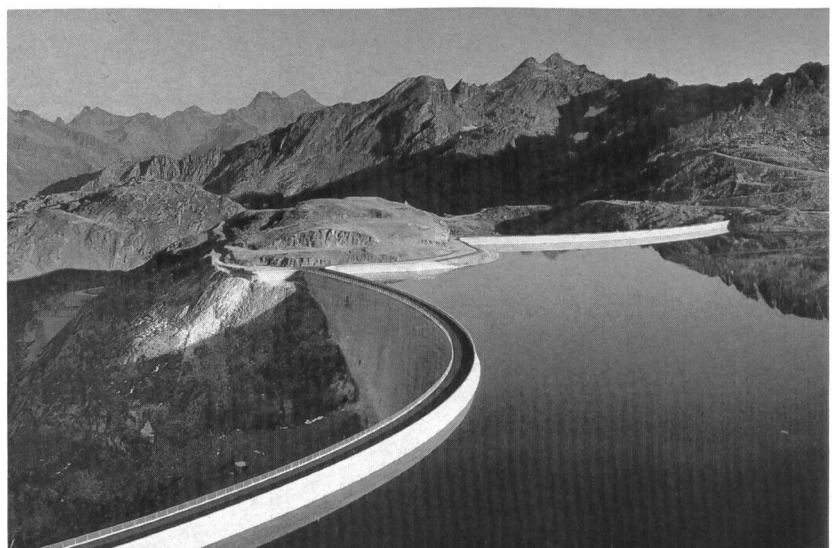
Bild 4. Stausee Naret.

Durch einen Vergleich der ein- mit der zweistündigen Session konnte die erreichte Genauigkeit abgeschätzt werden: die Restklaffungen der dreidimensionalen Transformation der einen Session auf die andere betragen in der Lage weniger als 1 mm, in der Höhe bis 2 mm. Die Repeitiergenauigkeit der GPS-Resultate zwischen zwei verschiedenen Messfenstern mit unterschiedlicher Messdauer (von mindestens einer Stunde) und unterschiedlicher Satellitenkonstellation ist also ausgezeichnet.