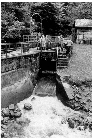
Bild 1. Der Wehreinflauf.

«unter uns», die Hauszeitung der industriellen Betriebe der Stadt Chur, hat im Heft 3/1996 darüber berichtet; gerne geben wir die Information auch den Lesern von «wasser, energie, luft» weiter.