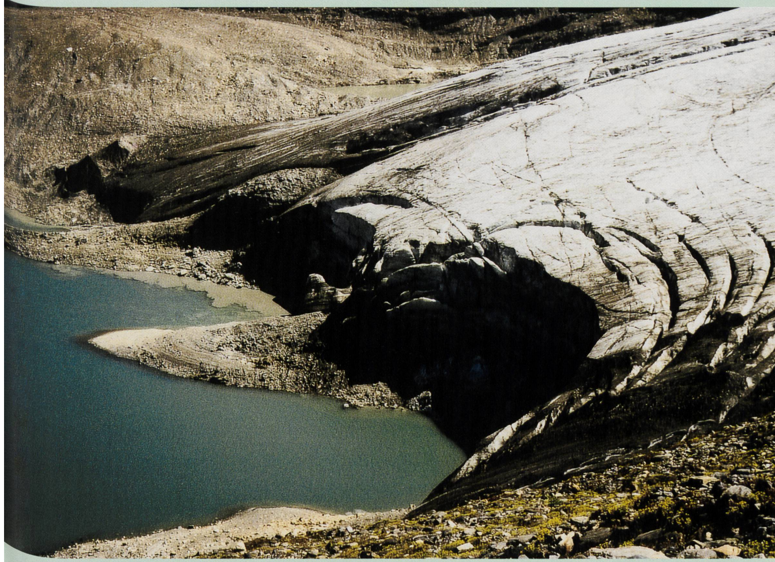
Die Zunge des Griesgletschers wurde nach dem ersten Aufstau des Griesstausees im Jahr 1966 überflutet und auf einer Länge von 142 m abgetragen. In der Folge endete der Gletscher im Stausee mit einer Kalbungsfront, die sich seither kontinuierlich um rund 400 m zurückgezogen hat. Das Bild zeigt das Gletscherende welches seit 1996 nicht mehr in Kontakt mit dem Stausee ist, im Herbst 1990 (siehe Beitrag S. 107ff.).