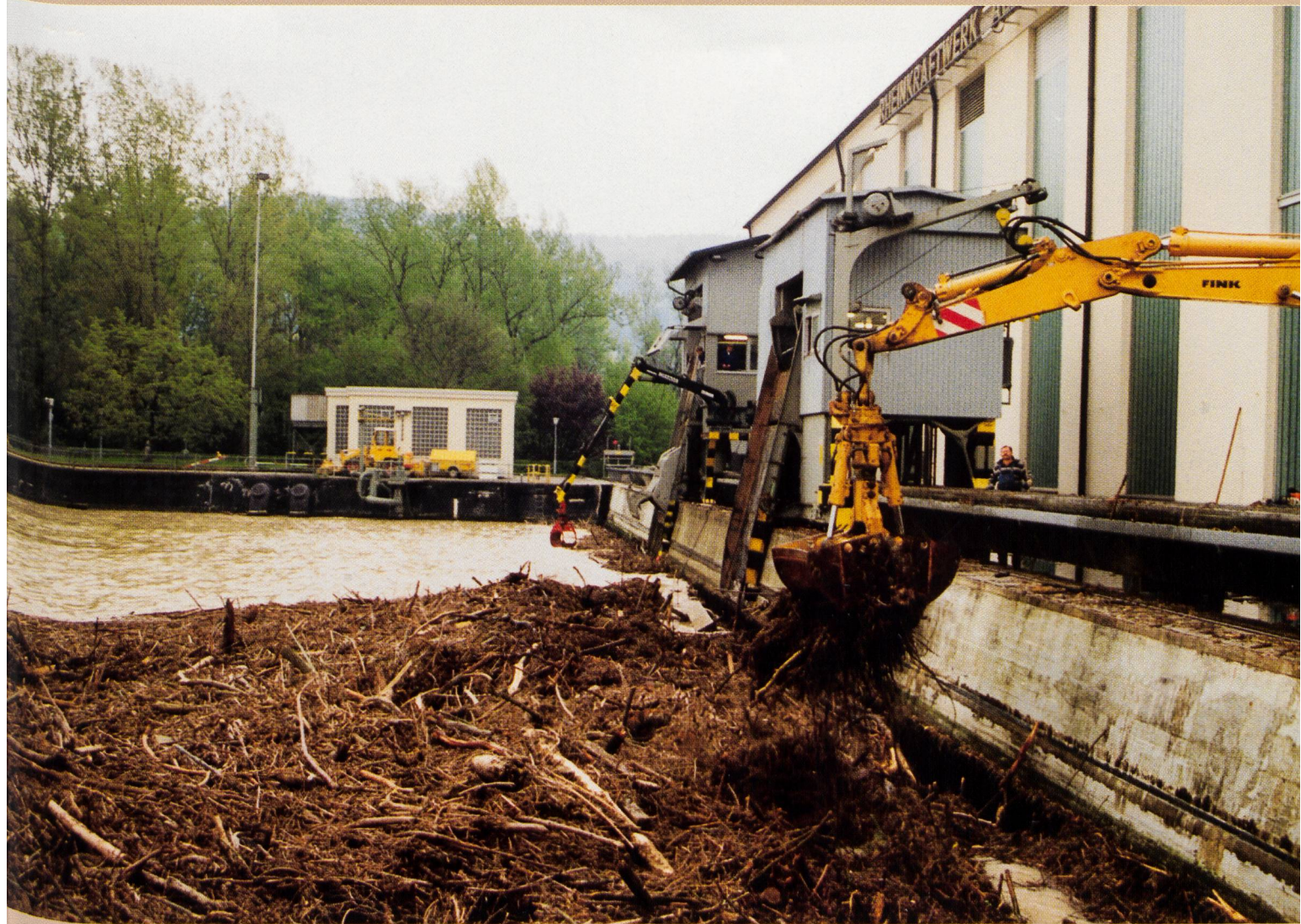
Starker Geschwemmselanfall am Rheinkraftwerk Albruck-Dogern beim Maihochwasser 1991. Im pausenlosen Einsatz versuchen die Betreiber mit zwei Rechenreinigungsmaschinen den Maschineneinlaufrechen freizubekommen. Diese werden durch einen mobilen Hydraulikbagger unterstützt. Die Rheinwasserführung betrug im Tagesmittel etwa 2000 m 3 /s; am 12. und 13. Mai fielen insgesamt rund 4000 m 3 Geschwemmsel an. Eine internationale Fachtagung in Bad Säckingen (D) vom Donnerstag, 13. November 1997, hat die Geschwemmselentsorgung durch die Kraftwerkbetreiber zum Thema.

Protection contre les crues Wasserrecht Talsperren Druckstollen Schifffahrt