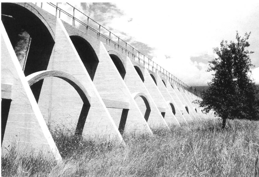
Figure 1. Vue du barrage des Marécottes depuis l'aval.

Le dispositif est finalement complété par la mise en place d'un contreventement assurant la stabilité de l'ensemble par solidarité des contreforts. Celui-ci se présente sous la forme d'une succession alternante d'arcs et de tirants, qui s'explique par la prise en compte des charges dynami-