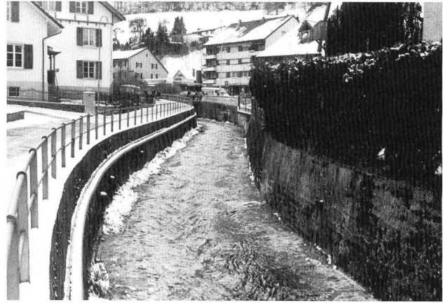
Bild 3. Vordere Frenke im Siedlungsgebiet: Der Fluss wurde kanalisiert, die Gewässersohle gepflastert. Die Vordere Frenke hat ihre Funktion als Lebensraum eingebüsst.

Bachforellen-Gewässer. Die Hintere Frenke entspringt auf etwa 930 m ü.M. Über zahlreiche Wasserfälle fliesst sie in einem wilden Felsbett steil nach Reigoldswil, wo das Gefälle abnimmt und sie dann hauptsächlich durch Gras- und Ackerland fliesst. Die Vordere Frenke entspringt auf 820 m ü.M. Ihr Quellgebiet ist eine typische Karstlandschaft: Das Wasser fliesst aus vielen Quellen zum kleinen Bach zusammen. Sie fliesst zuerst durch mehrere bewaldete Abschnitte, danach durch den Talgrund des stark besiedelten Waldenburgerfels. Die letzten Kilometer vor dem Zusammenfluss fliesst sie vor allem durch Gras- und Ackerland, welches auch die Umgebung der vereinigten Frenke bis Liestal prägt.