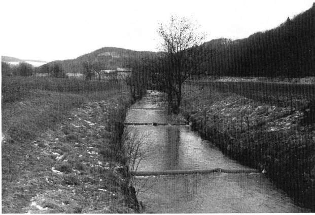
Bild 2. Monotoner Gewässerabschnitt im Landwirtschaftsgebiet: Die Gewässersohle ist mit Schwellen stabilisiert, der Böschungsfuss mit Betonplatten verbaut, das Umland intensiv genutzt.