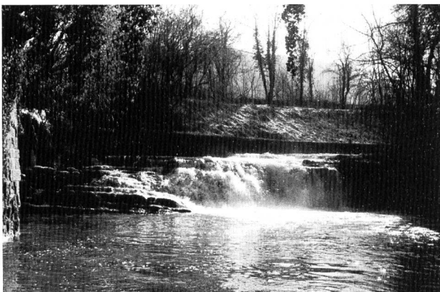
Bild 5. Wasserfall beim Steinenbrüggli oberhalb Liestal: Von der Ergolz her gesehen bildet dieser Wasserfall nach 1,2 km das erste natürliche Aufwanderungshindernis in der Frenke.

Im Rahmen der Untersuchung an den Frenken wurden auch die Mündungen der Seitenbäche erfasst und beschrieben, obwohl dies nicht Teil der verwendeten Buwal-Methode ist. Die Vernetzung mit den Seitengewässern würde erst auf einer weiterführenden Ebene, die das Gewässernetz als Gesamtsystem untersucht, genauer betrachtet (vgl. dazu [3]). Diese zusätzlichen Erhebungen verursachen jedoch wenig Aufwand und ermöglichen einen guten Überblick über den Grad der Vernetzung.