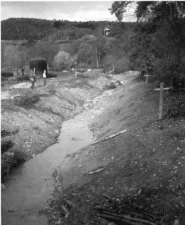
Bild 1. September 1997: Die Arbeiten am neuen Umgehungsgewässer sind beendet, das Gerinne wird in Betrieb genommen (Foto J. Loos, Wettingen).

Die Limmat mündet bei Untersiggenthal in die Aare. Kurz vor dieser Einmündung befindet sich das unterste Wasserkraftwerk der Limmat, das Kraftwerk Stroppe. Es ist das erste grosse Hindernis für Fische, die von der Aare in die Limmat und weiter Limmat-aufwärts wandern wollen. Zwar existierte eine Fischtreppe; sie erfüllte ihre Funktion aber nicht optimal. Die Treppe wies Höhenstufen von 30 bis 35 cm auf. Dies ist nach neuesten Erkenntnissen zu hoch und erzeugt eine zu grosse Wassergeschwindigkeit: Fische können solche Hindernisse nicht mehr überwinden.