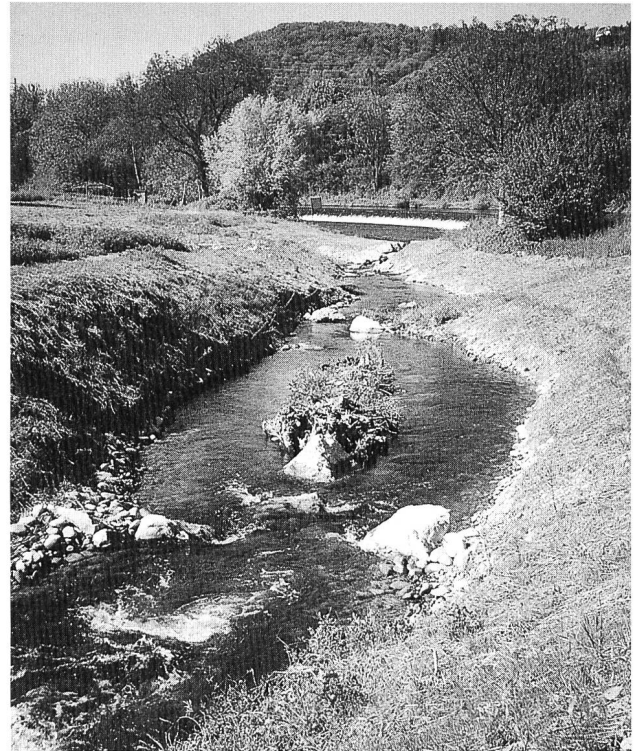
Bild 2. Juni 1998: Das Umgehungsgewässer dient Fischen und wirbellosen Kleinlebewesen als Aufstiegskorridor von der Aare in die Limmat.