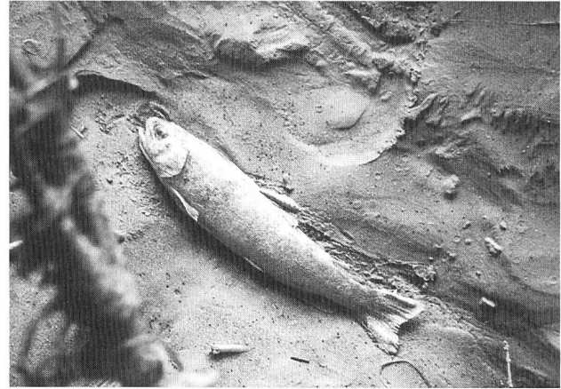
Bild 8. Während starker Hochwässers oder Stauraumspülungen ist die gesamte Bachsohle in Bewegung. Einige Bachforellen finden keine geeigneten Schutzstrukturen mehr. Sie werden durch die aggressive Sanddrift geschädigt und ersticken am Bachrand.

ranten Fischarten wie der Bachforelle zu massiven mechanischen Schädigungen kommen (Bild 8).