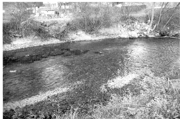
Bild 3. Forellenlaichgruben an der oberen Birs im Laufental.