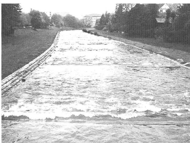
Bild 5. Für Forellen in der Birs im Raum Basel gibt es aufgrund des Regelfprofils nur wenige Sohlen- und Uferstrukturen und damit Deckung. Umfangreiche Kiesumlagerungen bei Winterhochwässern zerstören bereits angelegte Laichgruben oder verdriften die frisch geschlüpften Fische.