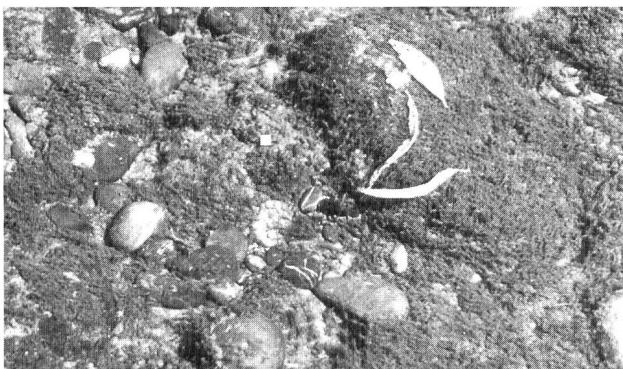
Bild 4. Sohlensubstrat der Thur bei Frauenfeld vor (oben) und nach (unten) einem kleineren Geschiebeereignis. Das Substrat wurde nahezu vollständig von Algenaufwuchs gesäubert.

Nur in Fließgewässern, die neben geeigneter Wasserqualität auch geeignete Substratstruktur und damit Fischstandorte, Nahrung und Reproduktionsräume bieten, kann sich eine stabile Fischpopulation entwickeln.