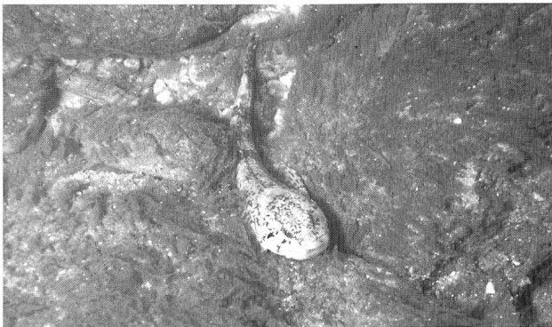
Bild 1. Verschiedene Fischarten sind in ihrer Lebensweise unterschiedlich stark an das Sohlensubstrat gebunden. Groppen nutzen die Steinzwischenräume als Deckung, sie gehen hier auf Nahrungssuche und legen ihre Eipakete unter Steinen ab (oben). Bachforellen nutzen grosse Deckungsstrukturen als Standorte. Zum Abbläuen benötigen sie lockeres Kiessubstrat (unten).

Gewässerökologisch wird Geschiebe weniger unter dem Gesichtspunkt des Massenumsatzes denn als bewegte Sohle des Lebensraums fliessgewässer betrachtet. Die beiden Hauptelemente, Wasserkörper und Sohlensubstrat, unterliegen einer ständigen Dynamik. Der bei starken Abflüssen in Gang gesetzte Geschiebetrieb kann das Gerinne neu strukturieren, Erosion verursachen oder dort, wo Material wieder aufgelandet wird, bestehende Strukturen nivellieren. Um den ökologischen Schaden oder Nutzen von Geschiebeverlagerungen beurteilen zu können, soll zunächst die Bedeutung des Sohlensubstrats für den Fisch betrachtet werden.