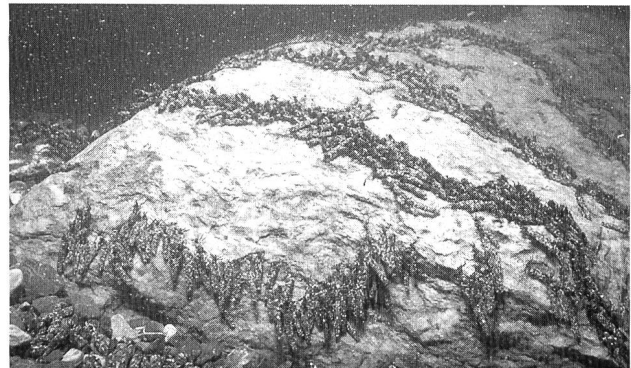
Bild 2. Köcherfliegenlarven auf einem Steinblock im Spöl GR. Sie gehören hier zu den wichtigsten Nährtieren der Bachforellen.

Fische müssen darüber hinaus in der Umgebung ihres Standortes Nahrung finden. Diese besteht in fliessgewässern hauptsächlich aus den auf und im Substrat lebenden wirbellosen Kleinlebewesen wie Insektenlarven, Kleinkrebsen und Würmern (Bild 2).