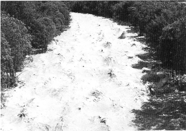
Bild 7. Spülung des Staubeckens Ova Spin oberhalb Zernez GR. Der Restwasserbach Spöl schwillt auf das über 50fache seines normalen Abflusses an. Stehende Wellen zeigen die Lage der wandernden Geschieberücken.