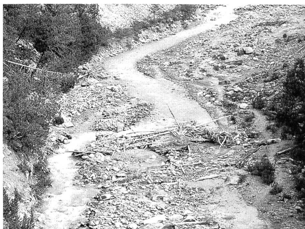
Bild 6. Der Fuornbach im Schweizer Nationalpark zeigt den noch typischen, durch grobes Geschiebe geformten Lauf eines unberührten Gebirgsbaches. Bei Hochwasser nutzt der Bach die gesamte Gerinnebreite, an deren Rändern strömungsberuhigte Zonen entstehen.

Besonders empfindlich gegenüber Geschiebetrieb sind Lebensgemeinschaften, die nur selten durch ein solches Ereignis gestört werden. Ein Beispiel dafür ist die Fischfauna in Restwassergerinnen unterhalb von Stauhaltungen, wo nur in mehrjährigen Abständen Spülmassnahmen stattfinden und damit über lange Zeiträume entscheidende Stressfaktoren wegfallen. Die Fischpopulation kann hier hohe Individuendichten erreichen und zunächst Standorte und vor allem Laichräume nutzen, die bei Geschiebe entfallen würden. Während eines Hochwasserereignisses oder einer Spülung (Bild 7) werden diese ersatzlos zerstört. Bei einem solchen Ereignis kann es auch bei strömungstole-