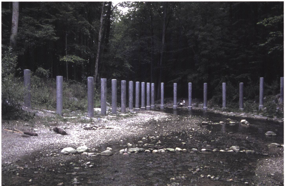
Bild 2. V-förmiger Schwemmholzfäng am Chämtnerbach/Kanton Zürich im ausgeräumten Zustand (Blick in Fliessrichtung; Bildnachweis: Amt für Abfall, Wasser, Energie und Luft des Kantons Zürich).

An der Versuchsanstalt für Wasserbau, Hydrologie und Glaziologie (VAW) werden zurzeit projektbezogene Modellversuche zum Schwemmholzurückhalt in Geschiebesammlern durchgeführt. Die untersuchten Rechentypen variieren hinsichtlich der effektiven Rechenfläche von kleinflächigen Rechen nur vor der Abflussöffnung des Geschiebesammlers bis zu grossflächigen