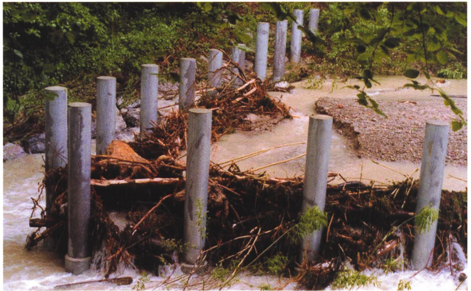
Bild 3. Beaufschlagter V-förmiger Schwemmholzfang am Chämtnerbach/Kanton Zürich nach dem Hochwasser vom 13. Mai 1999 (Fließrichtung von rechts).

Erst wenige Schwemmholznetze in Bayern sind bereits mit Hochwasser beaufschlagt worden. Dabei wurde die beabsichtigte Trennung des Schwemmholzes vom Geschiebe nicht erreicht. Statt dessen wurde an den Netzen sowohl das anfallende Schwemmholz als auch ein Grossteil des Geschiebes abgelagert (siehe Bild 5).