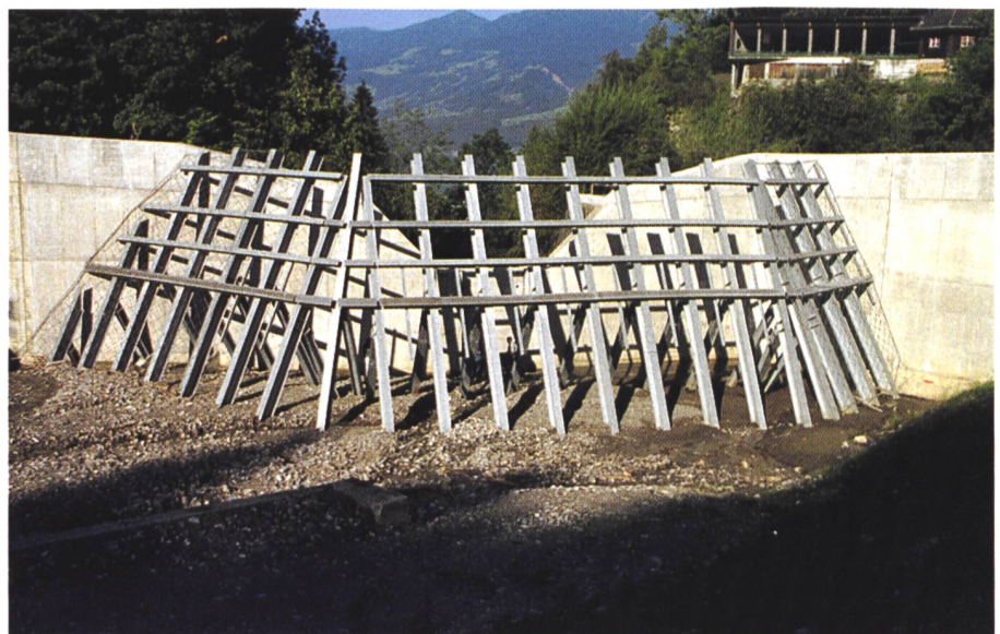
Bild 1. Rechenkonstruktion im Geschiebesammler am Dorfbach Sachseln/Obwalden (Blick in Fließrichtung).

Das Ziel eines funktionierenden Geschiebesammlers besteht analog zu einem Hochwasserrückhaltebecken darin, im Hochwasserfall nur das im Unterwasser hinsichtlich Menge und Korngrösse nicht zu verkraftende