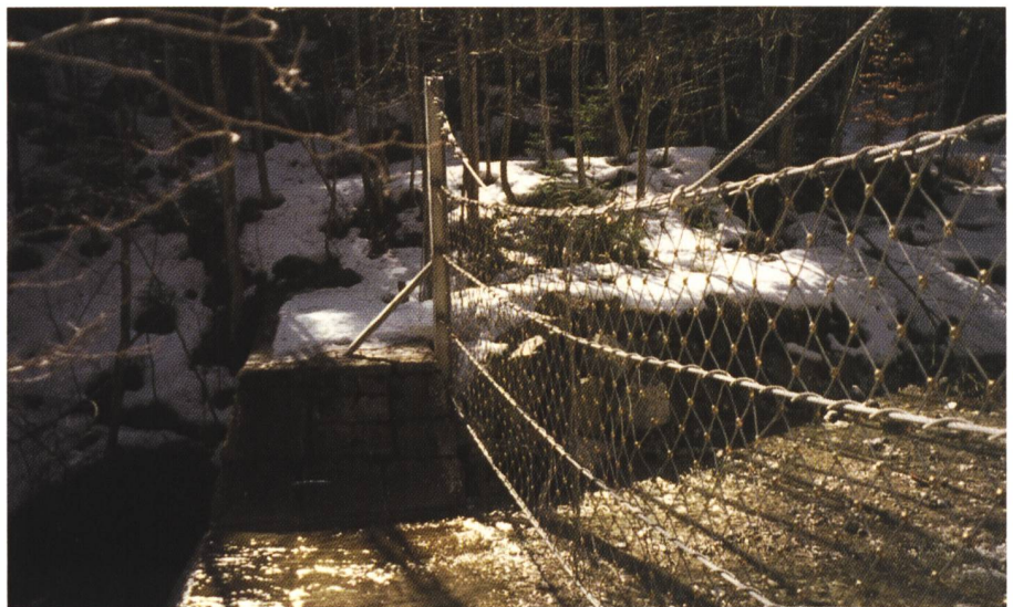
Bild 4. Schwemmholznetz am Lahnenwiesgraben/Oberbayern (Fließrichtung von rechts).