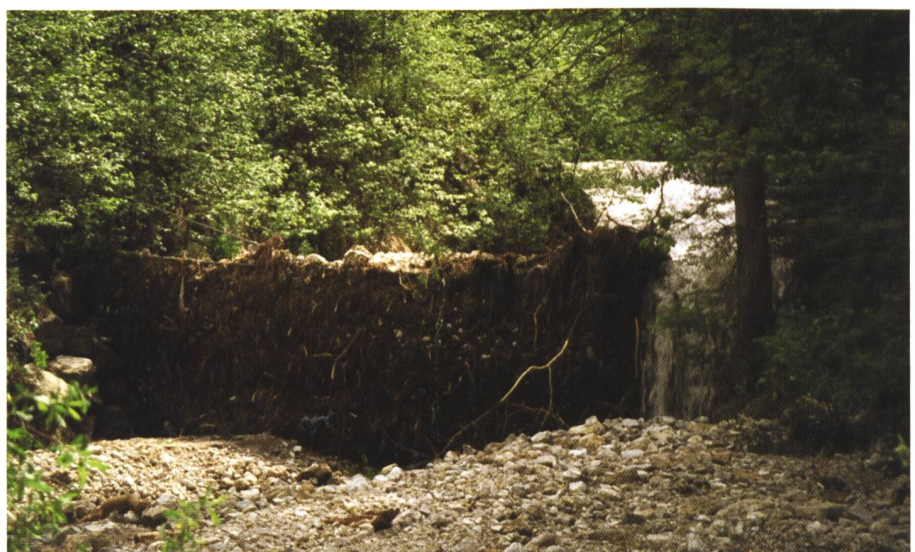
Bild 5. Beaufschlagtes Schwemmholznetz am Faulengraben/Oberbayern (Blick entgegen der Fließrichtung).