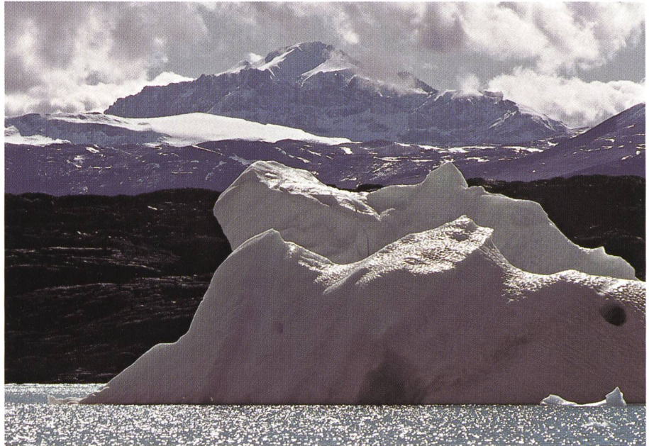
Bild 1. Die globale Erwärmung führt zu einem rascheren Abschmelzen der Eismassen der Erde und damit zu einem Anstieg des Meeresspiegels.

Seit Mitte des letzten Jahrhunderts gibt es kontinuierliche instrumentelle Aufzeichnungen von Klimaparametern wie z.B. Druck, Temperatur, Niederschlag usw. Damit können aber nur Veränderungen in diesem Zeitbereich erfasst werden. Die Klimaschwankungen verlaufen jedoch zum Teil über mehrere hundert bis zu hunderttausenden von Jahren hinweg. Die Rekonstruktion von Temperatur-