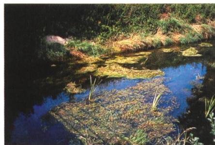
Bild 4. Verkräutung und Verschlämzung Rechter Hintergraben in der Nähe des Durchlasses Au.