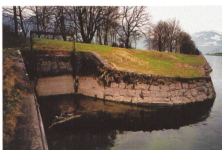
Bild 3. Durchlass Au mit Linth.