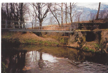
Bild 2. Durchlass Au mit Rechem Hintergraben.