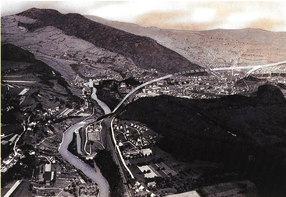
Bild 1. Verlauf des Umgehungskanals von Baden. Um die Gefällsstufe zwischen dem Kraftwerk Kappelerhof (vorne links) und dem Haselfeld (rechts, Bildmitte) zu überwinden, war eine «Schleusentreppe», bestehend aus zwei hintereinander geschalteten Schleusen, vorgesehen. Auf dem Wettinger Feld (rechts im Hintergrund) ist eine Kanalabzweigung sichtbar, die zu einem neu zu erstellenden Kraftwerk Aue geführt hätte (retouchiertes Luftbild, 1924).