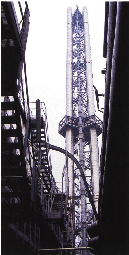
Bild 4. Rauchgasreinigung mit 80 m hohem Kamin.

die wichtige Rolle der Anlage jedermann vor Augen zu führen: Nutzung der Abfälle zum Vorteil der Menschheit und der Umwelt.