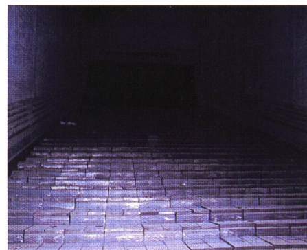
Bild 2. Der Verbrennungsrast.

Der nach üblichen europäischen Normen vorkategorisierte Haushaltabfall hat